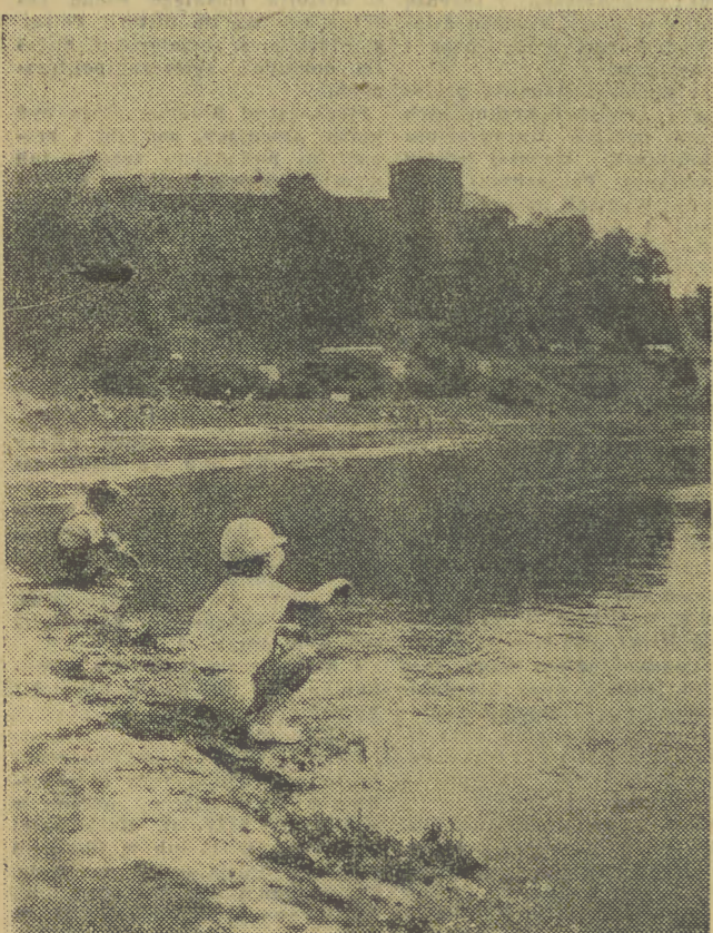
Nad Wisłą w okolicy Waweli zobaczyć można dzieci bawiące się nad samą wodą. Ponieważ rzeka ma tu kilka metrów głębokości, zabawa jest niebezpieczna, toteż tylko lekkożylni rodzicowie przypisali na nią swym pociechom.