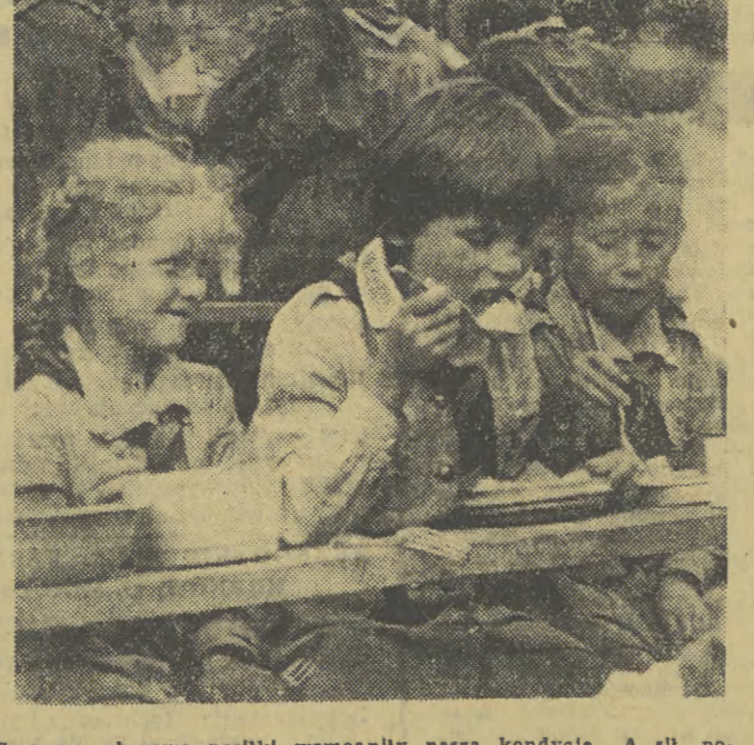
Smaczne obozowe posiłki wzmochny naszą kondycję. A sili potrzeba, bo za kilka dni idziemy do pracy — do szkoły — mówią harcerki z 33 KDH.

Rozwijający się ruch turystyczny, potrzebuje nowych