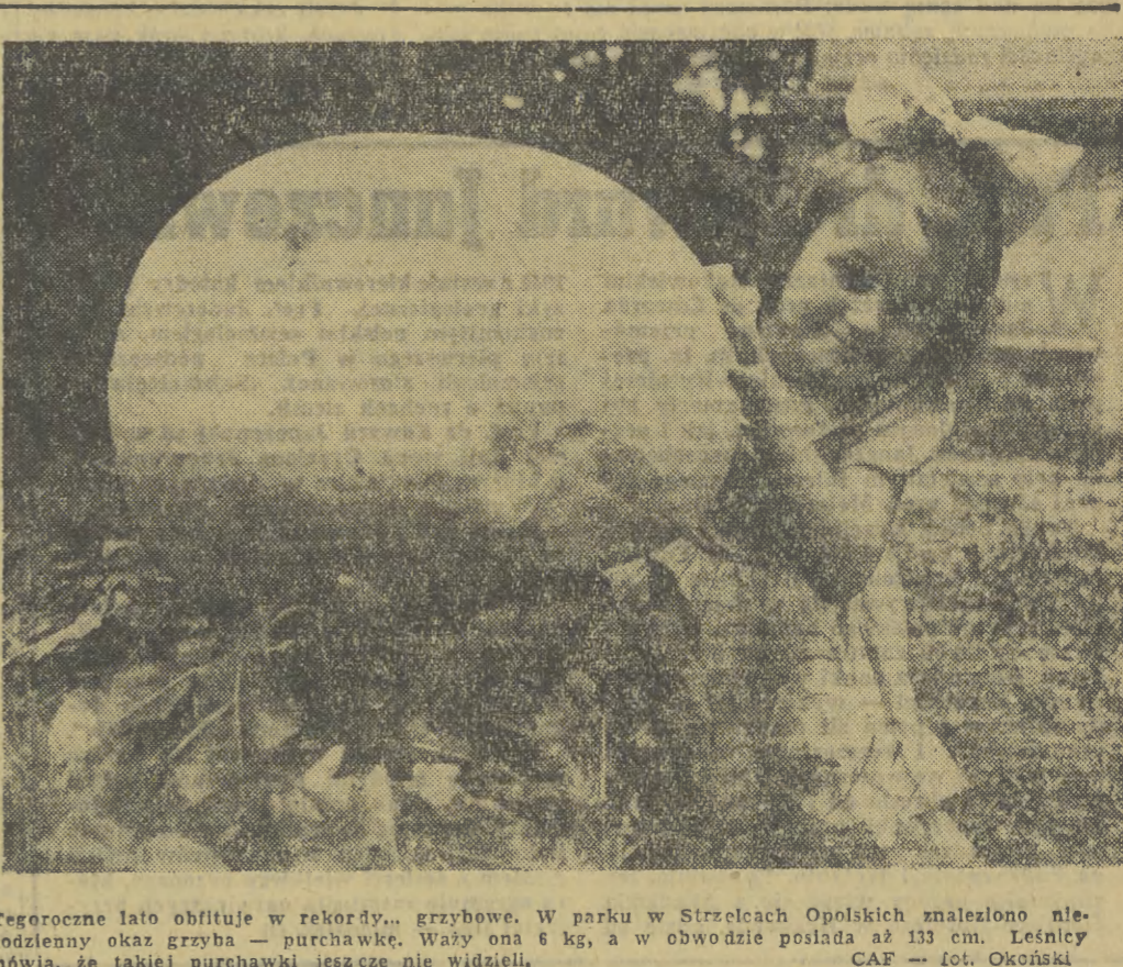
Tegoroczne lato obfituje w rekordy... grzybowe. W parku w Strzelcach Opolskich znalaziono niecodzienny okaz grzyba — purchawkę. Waży on 6 kg, a w obwodzie posiada aż 133 cm. Lśniący mówią, że takiej purchawki jeszcze nie widzieli.

Dyrekcja Studium przyjmuje także podania kandydatów bezpośrednio w sekretariacie Studium, w Krakowie, przy ul. Garbarskiej 1 w godz. 10-14 lub w Hill 5N5 w Nowej Hucie (tylko na Wydz. Ekonomiczny) Osiedle E-1, ul. Bulwarowa 13, w godz. od 15-17. Podanie o przyjęcie wraz z załącznikami należy składać tylko do 15 września br.