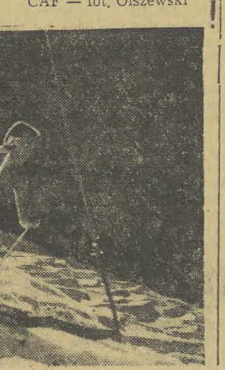
CAF — fot. Olszewski

W Tatrach w okolicy Morskiego Oka nad Czarnym Stawem leżą jeszcze duże plawy śniegu. Gracia Jasiewicz z AZS-u ustawiają tyczki słomiane na zbożu pokrytym śniegiem przeprowadzając treningi. Na zdjęciu: Na treningu nad Czarnym Stawem. CAF — fot. Olszewski