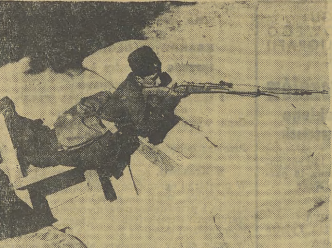
Te dwa zdjęcia nie wymagają podpisów... Są aż nadto wymowne. I bolesne.