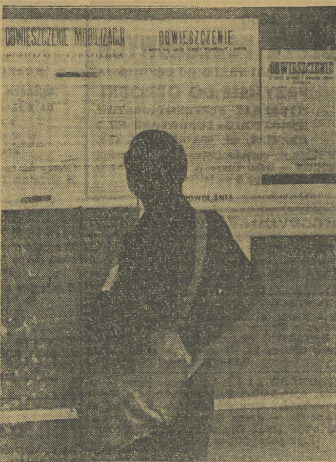
Kiedy pancerne dywizje hitlerowskie wkroczyły do stolicy Czechosłowacji, w marcu 1939 roku — dla każdego trzeźwo myślącego Polaka jasne było, że Hitler chce powiększyć „Lebensraum” trzeciej Rzeszy o ziemie nad Wisłą. Na zdjęciu: obwieszczenia o powszechnym mobilizacji, o poborze koni, wozów, pojazdów mechanicznych i rowerów, o zakazie sprzedaży i podawania napojów alkoholowych, które rozplakotane były w ostatniej chwili — za późno — bo w przeddzień wybuchu wojny...

Tymczasem w Giżycku — zaskoczenie. — Z TKKF? Z Krakowa? Żadnych pieniędzy nie otrzymaliśmy! Komu wpłaciłście?