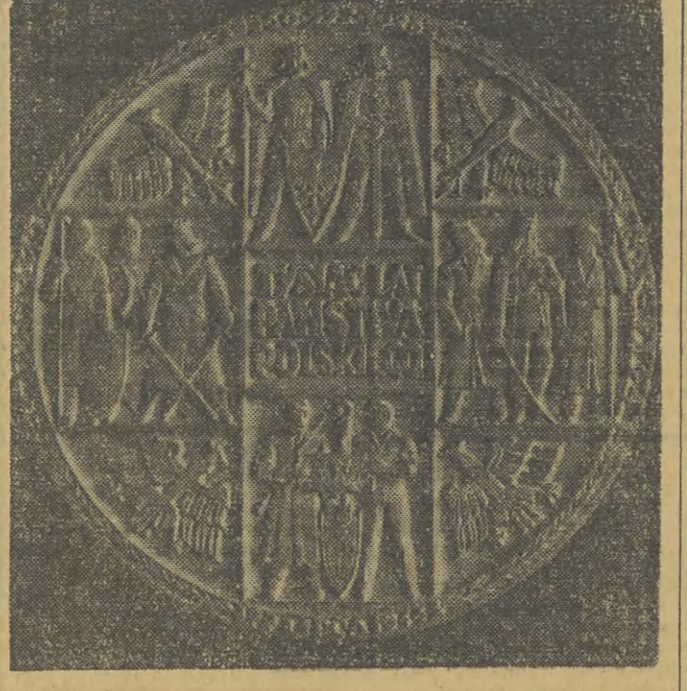
W celu zebrania odpowiednich funduszy na budownictwo szkolne w Milanówku Komitet Rodzicielski szkoły podstawowej nr 2 rozpoczął sprzedaż na terenie całego kraju gipsowego odlewu medalionu „Tysiąc lat Państwa Polskiego”. Autorami tego medalionu są znani warszawscy plastycy Wacław Kowalik i Czesław Pivowarczyk.

dząc, nie wiedzą też co zalogę nurtuje, co uważa ona za niewłaściwe w pracy fabryki. Wynik — nieprawidłowości w zakładzie wykrywa dopiero kontrola NIK.