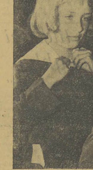
Przed nowym rokiem szkolnym.

W dniu 20 września w Warszawie odbędzie się konferencja Unii Międzyparlamentarnej, której obrady odbywać się będą w Warszawie, w mieście, które jest świadectwem okropności wojny, a zarazem żywym symbolem pokojowej woli i twórczej pracy naszego narodu.