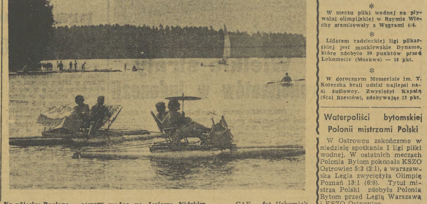
Na zdjęciu: Ruelane — rowery wodne na Jeziorze Nidzkim