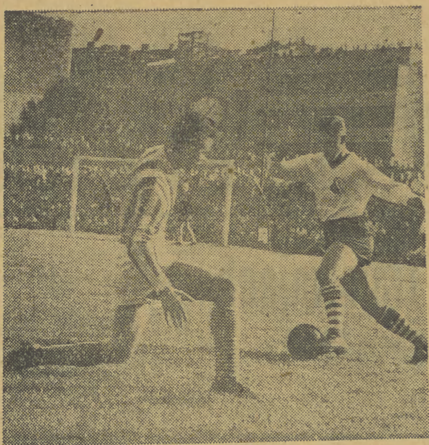
Zientara zwoodem ciata mija Fudaleja i za chwile pika fut bedze w posiadaniu na pastnikow Legii.