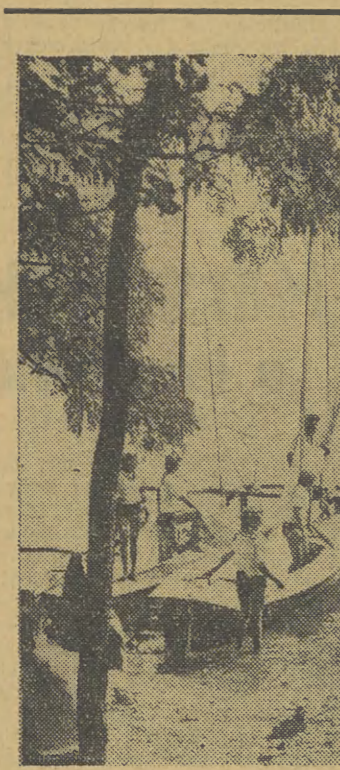
ŻEGLARZE SZKOŁĄ SIĘ NAD JEZIOREM RYŃSKIM

skiej jak i tych, które zostaną w ciągu najbliższych lat oddane do eksploatacji, pozwoliłoby na wydatne zwiększenie ich wydajności.