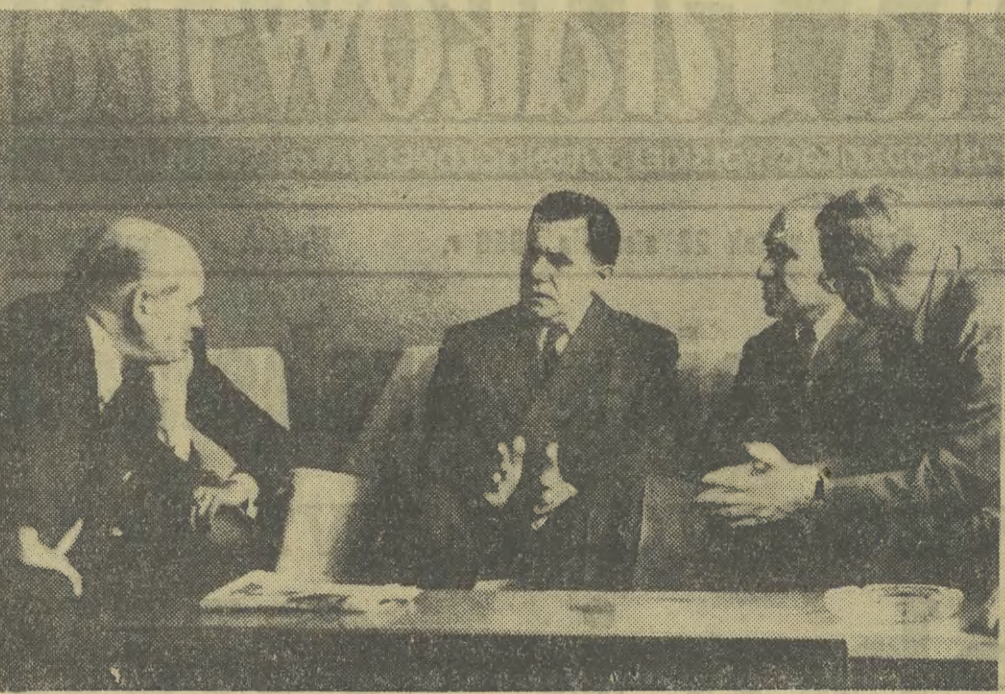
Na zdjęciu: Delegaci radzieccy i arabscy w kuluarach ONZ. Od lewej: Omar Loutfi — delegat ZRA, minister spraw zagranicznych ZSRR — Andrzej Gromyko, minister spraw zagranicznych ZRA — Mahmoud Fawzi i delegat radziecki — Arkady Sobolew.