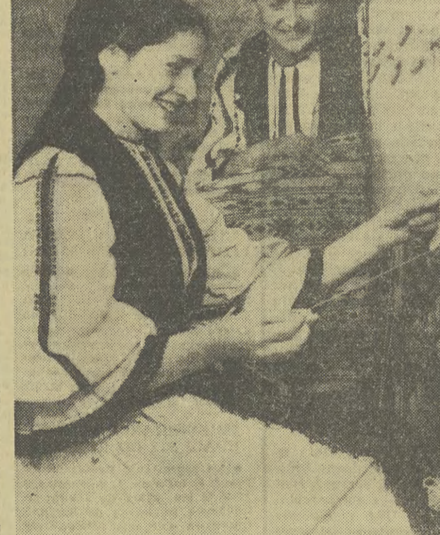
Na zdjęciu: rkanie dywanów w spółdzielni w Sibit.