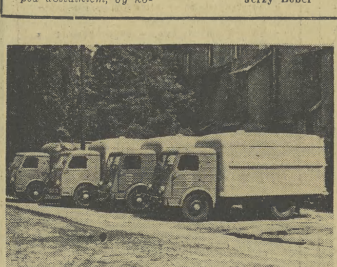
W takich wozach posiadających ścianki izolacyjną przewozi się obecnie w Krakowie produkty żywnościowe mało odporne na działanie wyższych temperatur, jak np. mięso i wędliny.