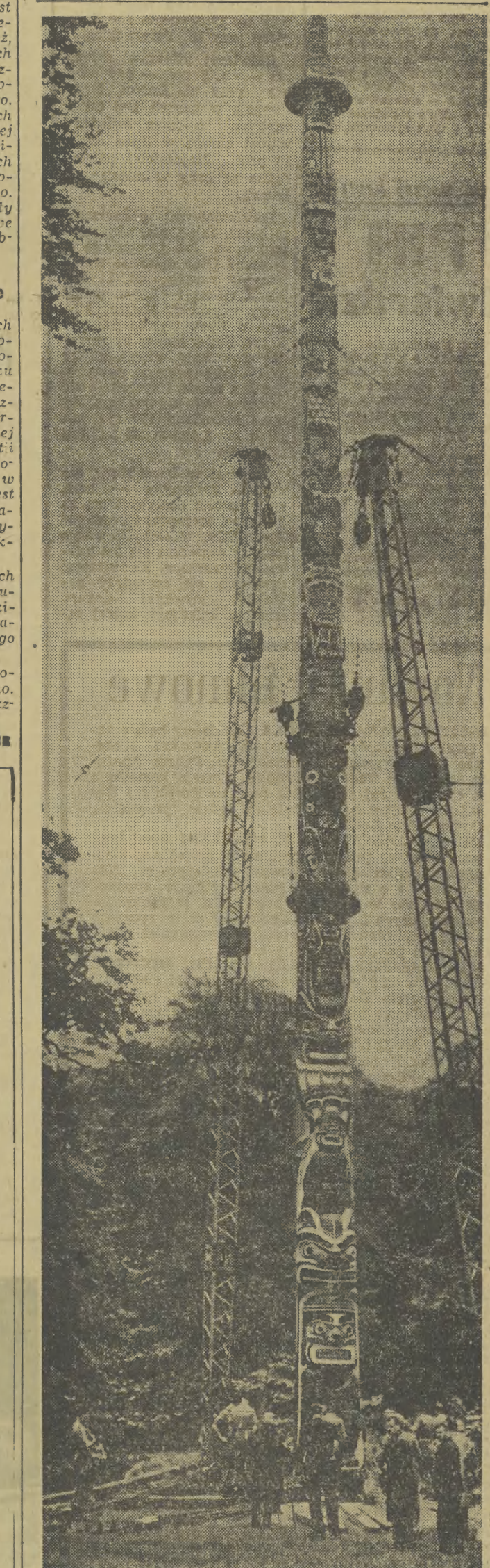
W parku w Windsorskim w Anglii ustawiono 30-metrowej wysokości słup totemiczny — prezent Kolumbijskiemu dla Królowej angielskiej.