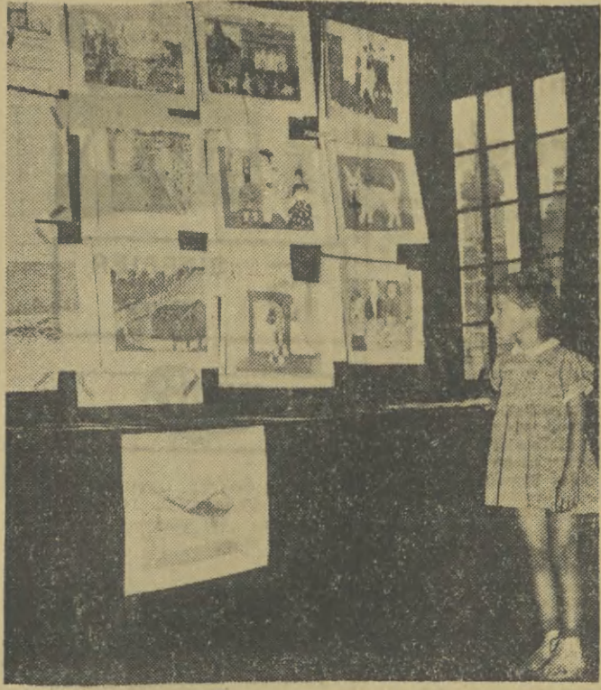
W KDK otwarta została wystawa malarstwa i grafiki Zespołu Amatorskiego Plastycznego przy KDK. Oprócz dorosłych — wystawiają swoje prace dzieci należące do dziecięcego zespołu malarstwiego (od 7 do 14 lat). Na zdjęciu: fragment sali z malarstwem dziecięcym. (Aplio)

w o j o w y m s o c j a l i z m u, jest po prostu koniecznością rozwojową naszego ustroju.