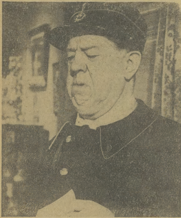
W tej komedii główna rolę odgrywa wytrawny aktor Michel Simon (mamy tam go z „Uroku szafana”, „Taksówki 3886” i ok. 80 innych kreacji filmowych). Reżyseria: Andre Hunebelle, scenariusz: Jean Halain.