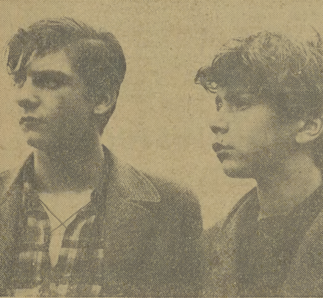
Tematem filmu jest los nieszczęśliwych porzuconych dzieci — sierot. Bohaterem — sędzia Lamy, w którego rolę występuje Jean Gabin. Reżyseria: Jean Delannoy, scenariusz na podst. książki G. Cesbron (luźna adaptacja).