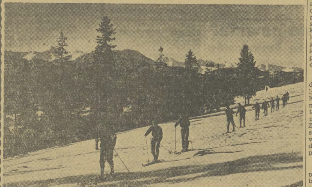
W Zakopanem przebywa na wspólnym treningowym obozie ekipa węgierskich narciarzy-biegaczy, którzy przygotowują się do bieżącego sezonu narciarskiego. Na zdjęciu: Biegacze węgiersey na treningu.