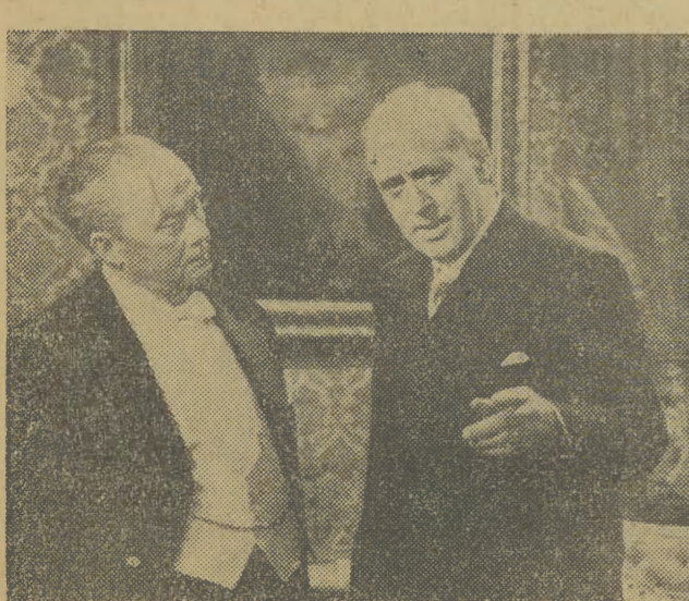
Film został opracowany na podstawie znanej sztuki J. B. Priestleya pod tym samym tytułem, granej często na scenach polskich. Film posiada doskonałą obsadę aktorską. Reżyseria: Guy Hamilton.