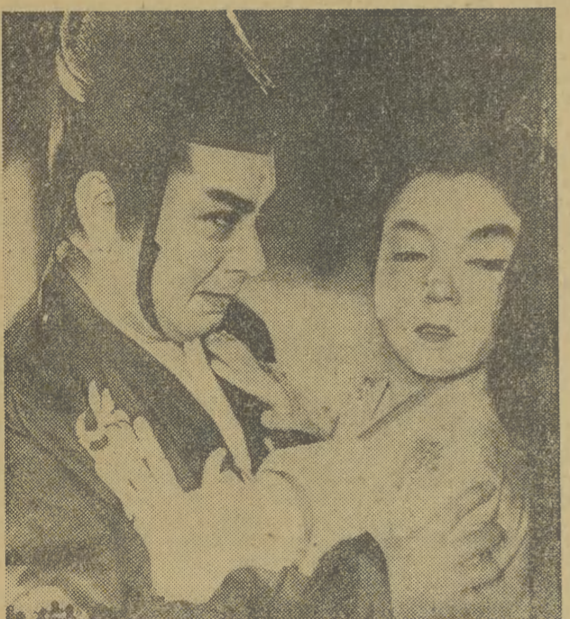
Treścią tego filmu historycznego (akcja rozgrywa się w XII wieku) są walki samurajów o tron cesarski. Wielka zaleta obrazu są piękne barwy. Reżyseria: Masashi Nogata.