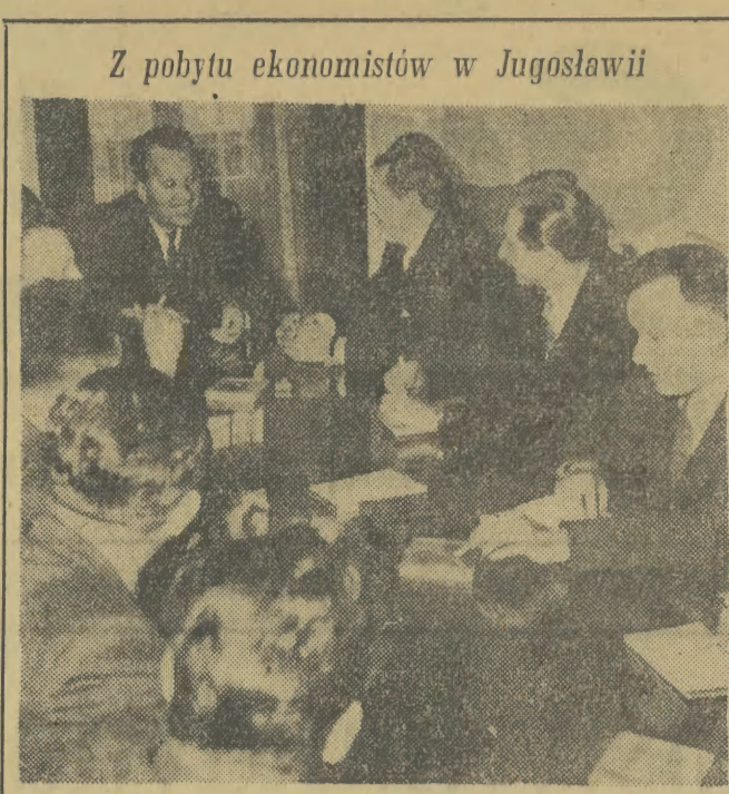
Z pobytu ekonomistów w Jugosławii

NOWY JORK (PAP). Zgromadzenie Ogólne NZ przystąpiło 14 bm. do rozpatrywania sprawy rozszerzenia składu Rady Bezpieczeństwa. Zdaniem poszczególnych delegacji przy ONZ rozszerzenie składu Rady Bezpieczeństwa stało się konieczne ze względu na wzrost liczby członków Organizacji Narodów Zjednoczonych.