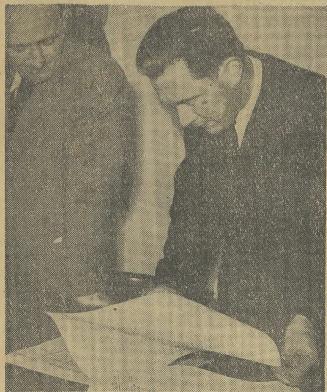
16 bm. obywatele naszego województwa rozpoczęli sprawdzanie list wyborców. Informacje na ten temat zamieszczamy na str. 2.

Proletariusze wszystkich krajów, łączcie się!