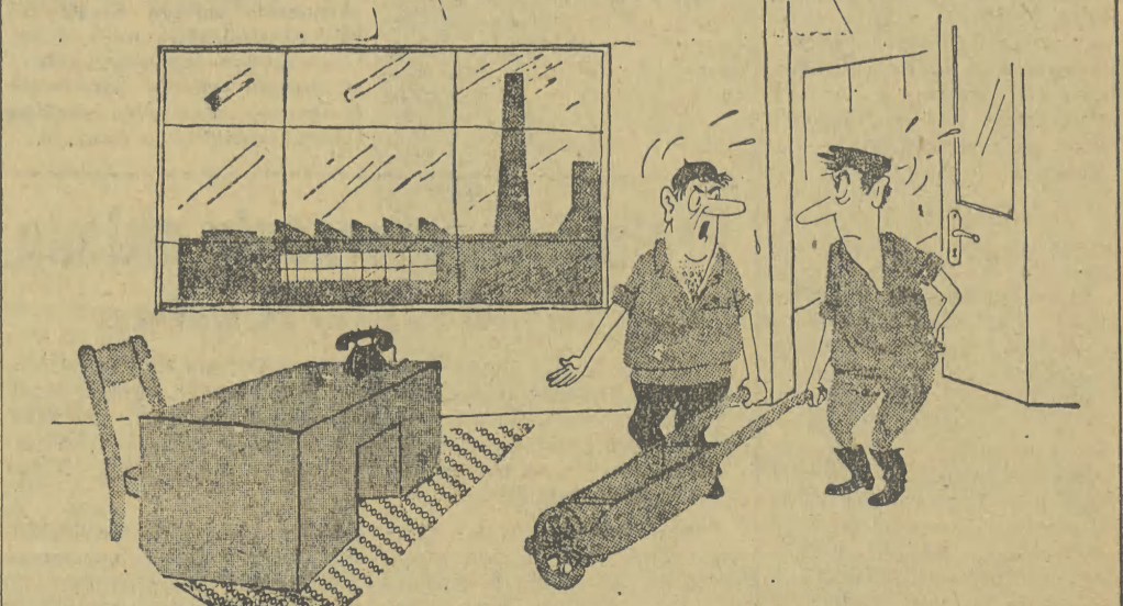
— Felus... Czy my się, aby, nie zagalopowaliśmy z tym wywożeniem na taczkach? Zostało tylko nas dwóch...

Czas letni na obszarze Polski obowiązywałby od 1 kwietnia do 15 września. Korzyści gospodarce w roku przyszłym tylko dla resortu energetyki byłyby z tego tytułu następujące: zmniejszenie zużycia energii elektrycznej na oświetlenie o ok. 87 mln kWh, obniżenie w okresie letnim obciążenia elektrycznego o blisko 110 tys. kW oraz dodatkowe zaoszczędzenie węgla w ilości ok. 140 tys. ton. Ponadto — jak się oblicza — można by za-