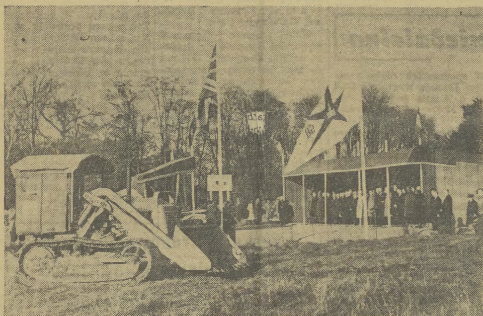
Przed Międzynarodową Wystawą 1958 r. w Brukseli. — Na zdjęciu: Rozpoczęcie prac na terenach wystawowych, na których zostanie wzniesiony pawilon Wielkiej Brytanii.