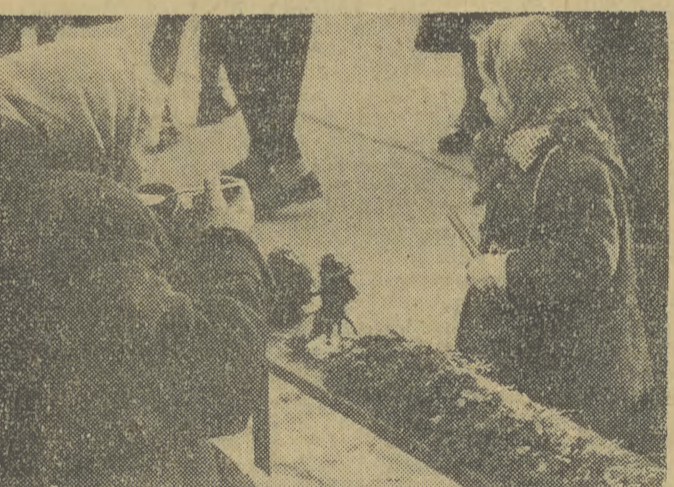
W dni przedświąteczne na krakowskim Ryńku

Mieszkam w Nowej Hucie na osiedlu A-Zachód, w którym budynki nie posiadają strychów i suszarni.