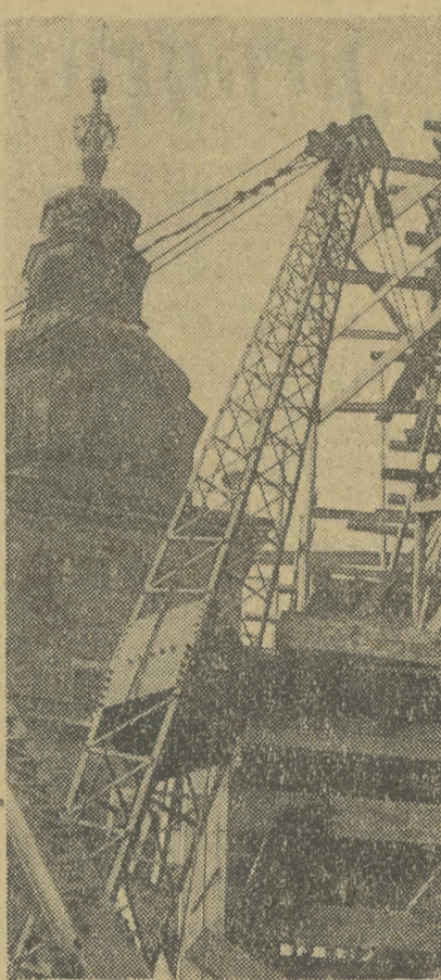
Dźwigi manipulacyjne składają z samochodów na ziemie kilkunetonowe belki żelazobetonowe.

Dotychczasowe ogrzewanie parowe w krakowskich Sukiennicach, wybudowane około 50 lat temu, ostatni krzyk mody ówczesnej techniki, było wręcz za-