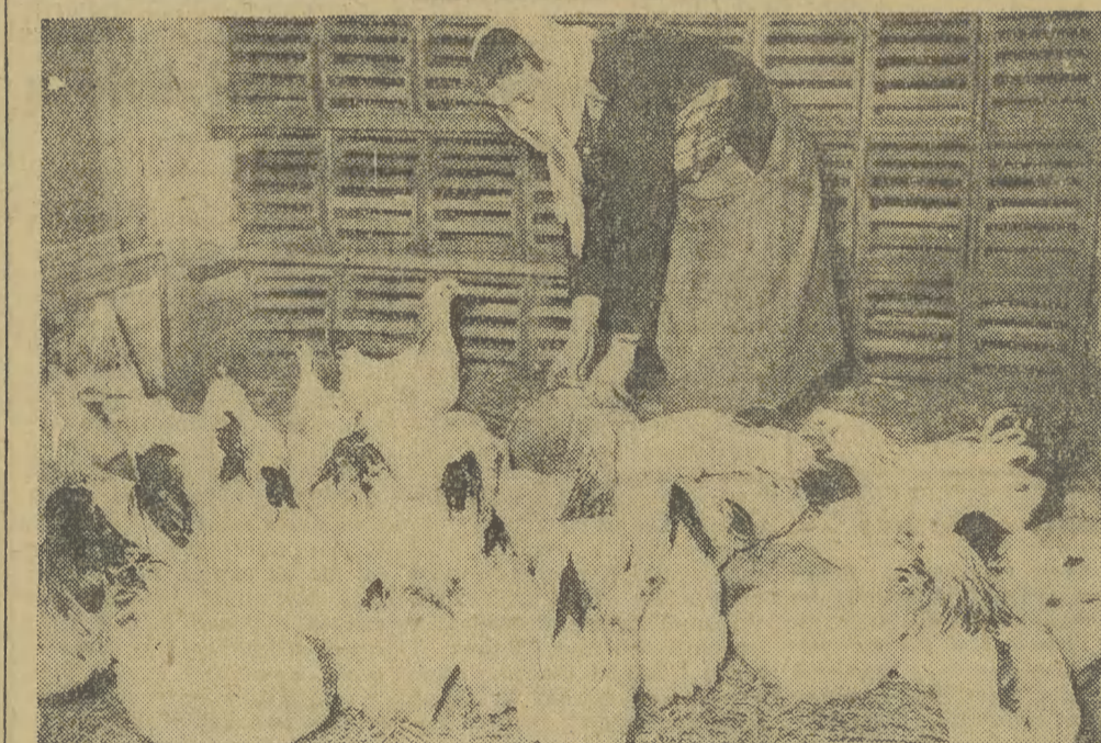
W Państwowym Gospodarstwie Rolnym Wituchowo pow. Międzybórz prowadzi się fermę kurczą na 2.000 sztuk. Ferma ta przynosi około 150 tys. zł rocznego dochodu. Na zdjęciu: pracownia fermy przy karmieniu kur.