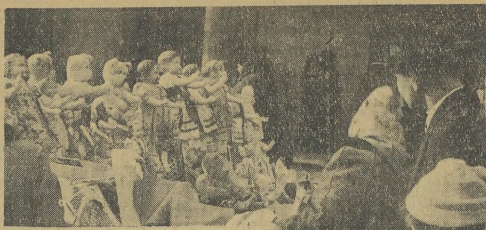
Głównym gwarem rozbrzmiewa obecnie krakowski Rynek, na którym — wzdłuż Sukiennic — liczn sprzedawcy ustawili swoje stoiska. Oto jedno z nich, przy którym w związku na rodzaj towaru często zatrzymują się dzieci

W porównaniu z rokiem ubiegłym — krakowska MO, do której zwróciliśmy się po informacje, notuje dość pokątny wzrost liczby wypadków śmiertelnych na torach kolejowych. Jest rzeczą zdumiewającą, że nawet kolejarze, a więc ludzie — wydawałoby się — szczególnie do ostrożności predestynowani, często (i to wyłącznie w własnej winy) stają się ofiarami wypadków. Jak to dowodzą przytoczone fakty, że we wrześniu br. 5 kolejarzy poniosło w służbie śmierć, czterech — ciężkie obrażenia. Ogólna zaś ilość wypadków w Krakowskim węzle kolejowym stale w tym okresie liczby dwudziestu! Do dziś dnia wspomina się w tamtych stronach sprawę braci