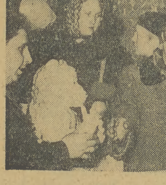
Grudzień to miesiąc, w którym jest wiele okazji do obdarzania bliskich podarkami. Najwięcej upominków otrzymują przeważnie najmłodsze. Ale wybór nie zawsze jest łatwy. Trzeba bowiem godzić własne „możliwości finansowe” z pragnieniami dzieci.

Oby ten wniosek był jak najszybciej zrealizowany. (al)