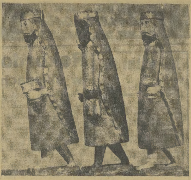
Trzej Królowie — rzeźba Jana Lumeckiego (Dąbrowa Zielona p. Radomsko). Patrz artykuł obok.