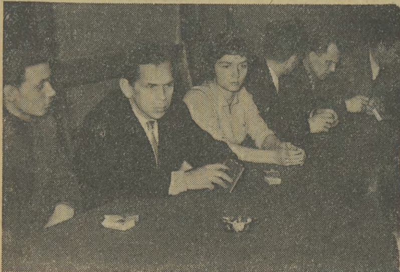
Członkowie delegacji KC Komsomolu podczas spotkania z nowoukuckim aktywem ZMS.