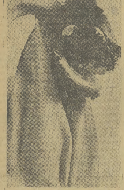
Turoń z Krakowskiego.