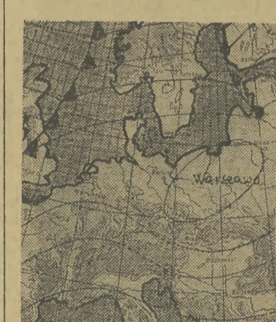
Mapa synoptyczna z godz. 00 dn. 18 XII 1957 r.

Wczoraj w Polsce najniższym było w centrum wiatu na Kujawach, gdzie notowano temperaturę do minus 8 st. (Toruń — 8 st.). Nad morzem temperatura utrzymywała się w granicach 5-6 st. poniżej zera (Gdynia — 5, Kolobrzeg — 6, Szczecin — 5 st.). Najcieplej było na południu kraju (Kraków — 3 st.). Drobny opad śniegu ziemistego spadł na Śląsku i w Rzeszowskim. Kraków nawiedziły tzw. lodowe igły. Marznąca mżawka z mgły wystąpiła miejscami na Dolnym Śląsku.