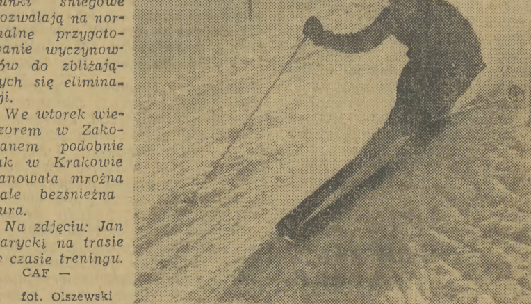
Po kilkudniowej przerwie spowodowanej halną - kiem naciarcie rozpoczęli treningi na Kasprowym Wierchu - jedynym terenie w Tatrach, gdzie warunki śniegowe pozwalają na normalne przygotowanie wycieczników do zbliżających się eliminacji.

W Indonezji rozegrano międzynarodowy turniej piłkarski, w którym uzyskano następujące wyniki: Wac-ker (Wiedeń) - Dżakarta 6:2, Buł-garia - Bandung 6:2.