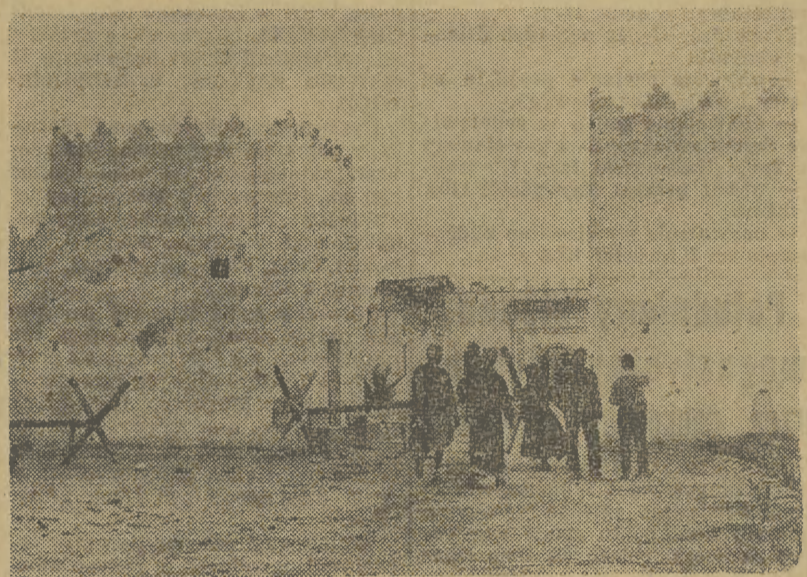
Marokańscy obejmują w posiadanie hiszpański fort Titonine w pół-wschodniej części Ifni.