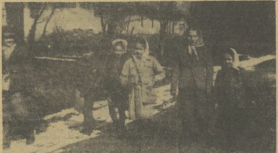
Dzieci chodzą do szkoły po kilka, a czasem nawet i więcej kilometrów. I o tej sprawie nie zapomniano przy opracowywaniu wielkiego planu.