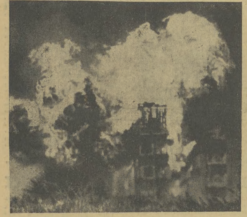
Zdjęcie to dokonane zostało na przykład Canaveral na Florydzie w momencie eksplozji rakiety amerykańskiego sztucznego satelity podczas nieudanej próby jego wyrzucenia.