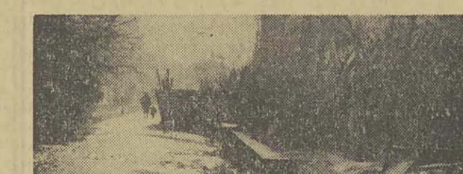
Można dyskutować nad tym, co dzieje się wewnątrz teatru: czy sztuka była bardziej lub mniej udana. Jeśli chodzi jednak o zewnętrzne jego otoczenie — tu nie ma chyba dyskusji — te „dekoracje” są bardzo nieładne.

A jest to przecież obiekt nie byle jaki. Teatr im. J. Słowackiego jest budynkiem w całym tego słowa znaczeniu reprezentującym miasto. Trzeba jak najszybciej doprowadzić do porządku jego otoczenie.