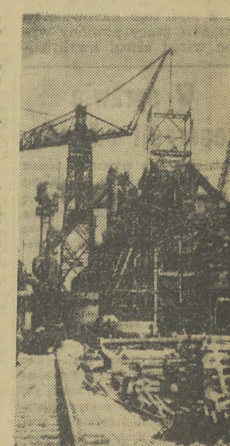
Dama naszej sześciolatki

Książka Darwina jest bogato ilustrowana i posiada piękną szatę graficzną.