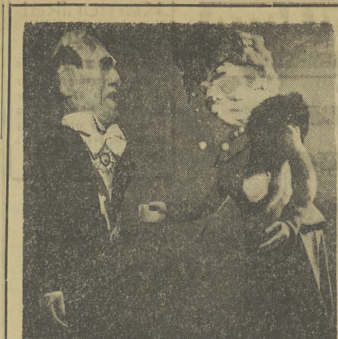
W sali Klubu Międzynarodowej Książki i Prasy przy ul. Nowy Świat w Warszawie — odbywają się polskie „Sopki Satyryczne 1956”. Autorami tekstów literackich są: Antoni MARIANOWICZ, Janusz MINKIEWICZ, i Marian ZAŁUCKI, kubieli — Jerzego ZARUBY.

Po wsi latała nowoformulowana opinia, nowy strzał przeciw spółdzielczości będący uzupełnieniem — w nowej sytuacji — starej opinii.