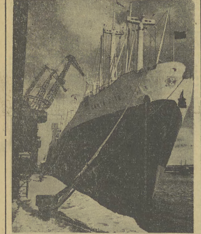
Statek Niemieckiej Republiki Federalnej „Santa Rita” w porcie. „Santa Rita” załadunku towarów dla krajów Ameryki Południowej.