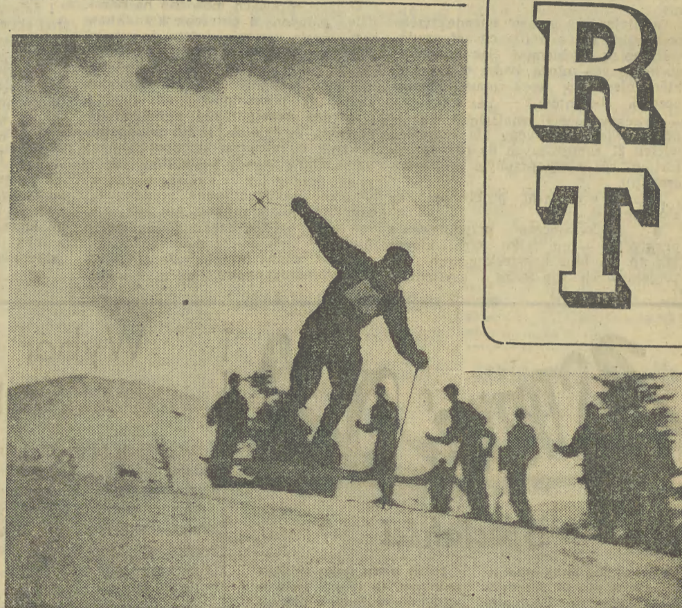
Taką zimę, jak widzimy na zdjęciu, mieli w czasie świąt tylko narciarze wysoko w Tatrach.

W pierwszej tercji Polacy uzyskali zdecydowaną przewagę, ale już w 4 min Finowie niespodziewanie uzyskali prowadzenie. Następnie krótki okres dobrej gry Polaków. Na lodzie przebywa wtedy atak pierwszy — Kurek—Nowak—Janiczko. Przewagę swoją dokumentują Polacy dwiema bramkami zdobytymi przez