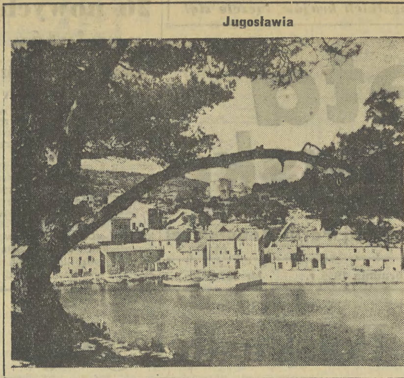
Na zdjęciu: Losinj Veli, miejscowość na wyspie Losinj, nad północną częścią Adriatyku.

Dobrym znakiem czasu jest projekt nowego Kodeksu Karnego nie tylko dlatego, że lepiej, na wyższym poziomie stawia sprawę naszego wymiaru sprawiedliwości. Dobry to znak czasu dlatego, że w ostatecznym uformowaniu Kodeksu weźmie udział całe społeczeństwo. Partia nasza pragnie, by Kodeks jak najbardziej odpowiadał poczuciu prawa naszego ludu, by jak najlepiej był dostosowany do podstawowych zasad naszego ustroju.