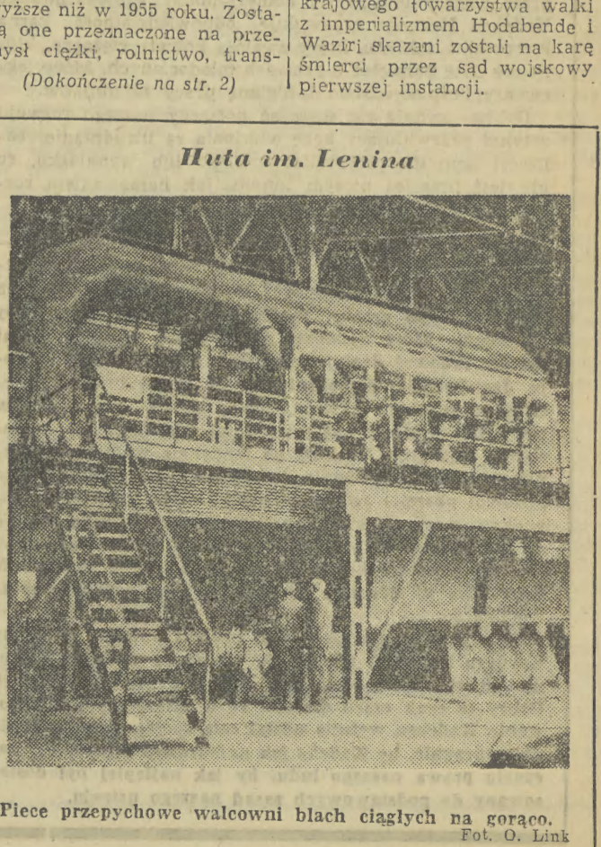
Piece przepychowe walcowni blach ciągłych na gorąco.