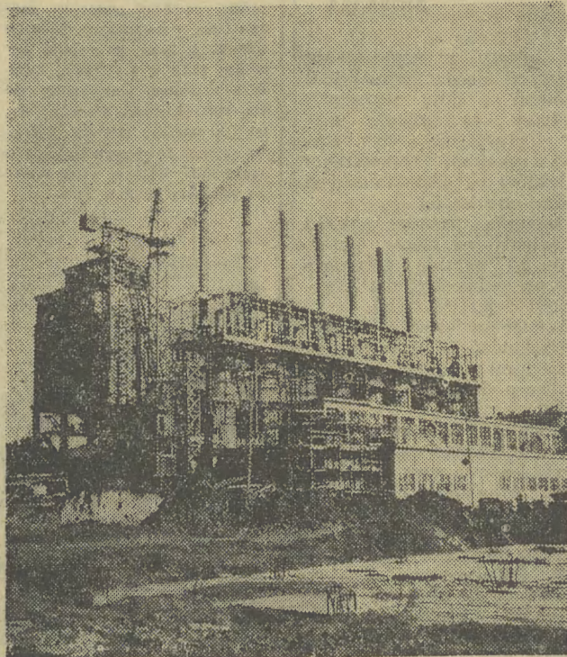
Już w krótkim czasie rejon stalowni Huty im. Lenina wzbogaci się o jeszcze jeden ważny obiekt produkcyjny. Będzie nim dolomitownia - wytwórnia wartościowego materiału ogniotrwałego służącego do wyurnowki pieców martenowskich.