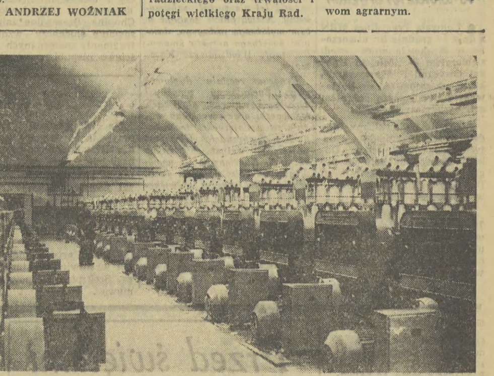
Zakłady podległe Ministerstwu Przemysłu Lekkiego po wykonaniu na 10 dni przed terminem planu rocznego sadzą do końca roku dodatkowo 8 mln. metrów tkanin bawełnianych, 1,8 mln. metrów tkanin jedwabnych, 800 tys. metrów tkanin wełnianych, 340 tys. par obuwia, 3,4 mln. sztuk wyrobów dziewiarskich. Do największych budowl Planu 6-letniego w rolnictwie przemysłowym należą Zakłady Przemysłu Bawełnianego. Pierwsza część zakładów rozpoczęła normalną produkcję w II kwartale br. Druga część zakładów znajduje się jeszcze w budowie. Zakłady w Zambrze budowane są w oparciu o wszechstronną pomoc Związku Radzieckiego. Na zdjęciu: fragmenty oddziału samoprzężnic obrządkowych.

W zbiorze znajduje się też wiele przemówień Lenina, poświęconych sprawom sojuszu robotniczo-chłopskiego i spraw agrarnym.