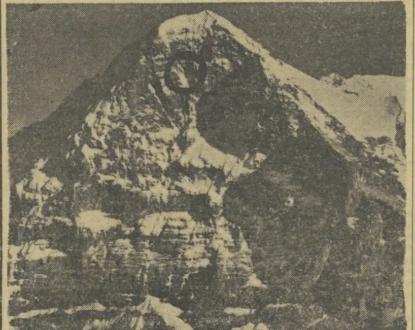
Przełęczna śnieżna Elzeta. Kółkiem oznaczone miejsce, w którym rozgrywał się dramat czterech zaginionych alpinistów. Zdjęcie do artykułu zamieszczonego na str. 4.

(Pozostałe wiadomości sportowe na str. 4).