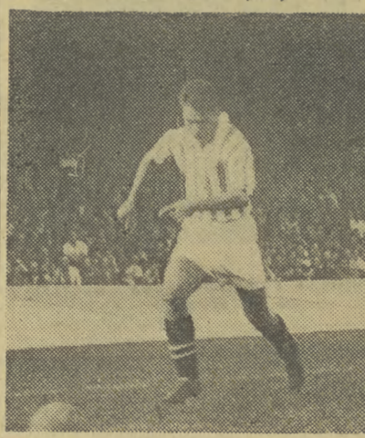
Fragment meczu Cracovia—Garbarnia.