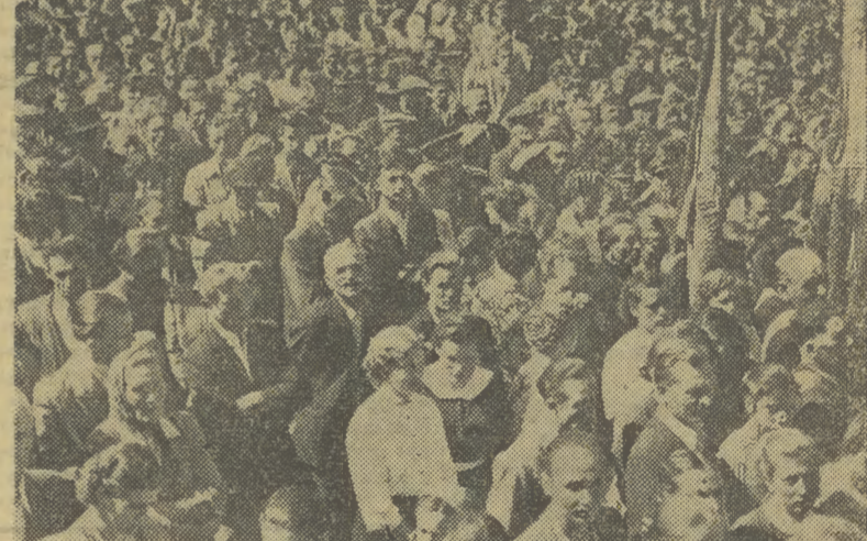
Z uroczystości w Wierchosławicach. Na zdjęciu: fragment wiecu.