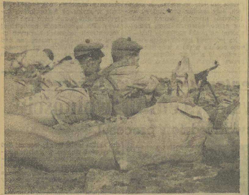
Na zdjęciu: Na polychach bojowych — żołnierze wojsk brytyjskich...