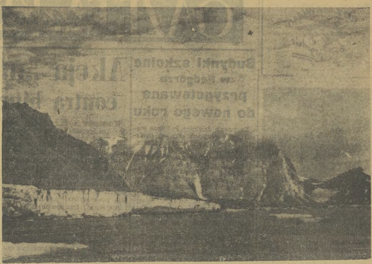
Do art. pt. „Polscy uczeni na Spitsbergen”. Fiord Hornsund.

Po trzecie: Dyskusja ideologiczna w partii jest zarazem głównym ogniskiem promieniowania jej ideologii na społeczeństwo. Potrzeba takiego promieniowania nie jest wielka, jeśli wznosi się socjalizm biurokratyczny, gdyż wówczas zadrzewiająca niska jest cena opinii społeczeństwa. Natomiast obecny okres odnowy wymaga owego promieniowania w stopniu nieograniczonej. Im bardziej partia liczy się z opinią społeczeństwa i odwołuje się do jego woli, tym bardziej musi kształtować opinie tego społeczeństwa czyli wychowywać je w duchu socjalistycznym.