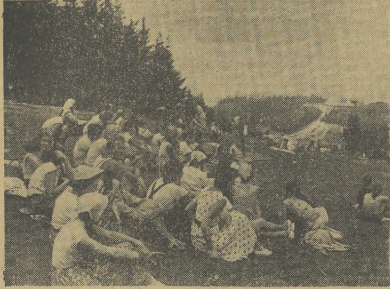
Po kilkutygodniowym odpoczynku w kraju setki dzieci Polonii zagranicznej już za kilka dni wyjadą do Belgii, Francji, Anglii, Holandii, zaciągając na długą w pamięci wesoło spędzone wakacje oraz piękno ojczystego kraju.

Na zdjęciu: Po długiej wędrówce — odpoczynek na polanie pod Szyndzielnią (dzieci z Austrii, Belgii i Francji).