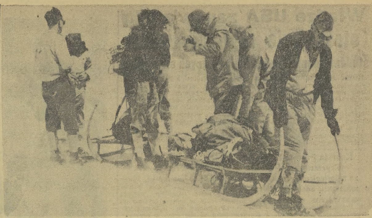
Największą chyba w historii tego rodzaju przedsięwzięcia była wyprawa ratunkowa spiesząca z pomocą ofiarom dramatu, jaki rozegrał się ostatnio na płn. ścianie Eigeru w Alpach. W akcji ratowniczej uczestniczyło kilkudziesięciu alpinistów z 5 państw. Mimo bezprzykłądnie wysokiego — wyprawa działała u szczytów burzy śnieżnej — z objętej górskiej śmierzki udało się wyratować tylko jednego z 4 zaginionych alpinistów. Na zdjęciu: transport sprzętu ratunkowego przez uczestników wyprawy.

Tym razem piłkarze Garbarni w zupełności zrehabilitowali się przed swą publicznością. Wygrali w niedzielę z Szombierkami 3:0 (1:0) i zdobyli wdzieczność kibiców Cracovii. Zwycięstwo krakowian jest całkowicie zast zone, a przy odrobieniu szczęścia mogło być jeszcze wyższe. Wprawdzie do przerwy gra była wyrównana, a nawet goście okresami przeważali, to jednak druga po-