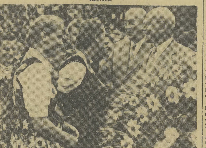
Tow. Gomułka i tow. Cyrankiewicz przyznają wieniec dożynkowy od mieszkańców Kasinki.