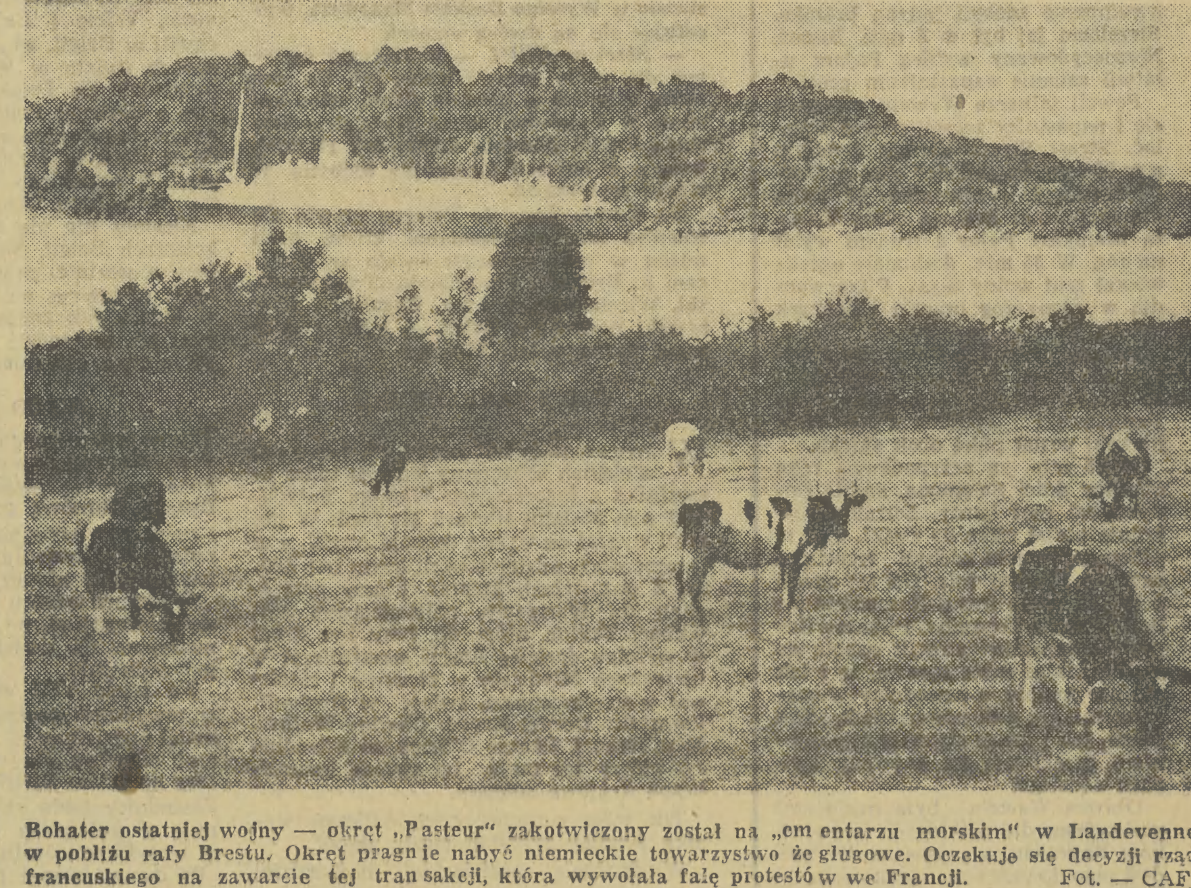
Bohater ostatniej wojny — okręt „Pasteur” zakotwiczony został na Landevenne, w pobliżu rafy Brestu. Okręt pragnie nabyć niemieckie towarzystwo żeglowne. Oczekuje się decyzji rządu francuskiego na zawarcie tej transakcji, która wywołała falę protestów we Francji.