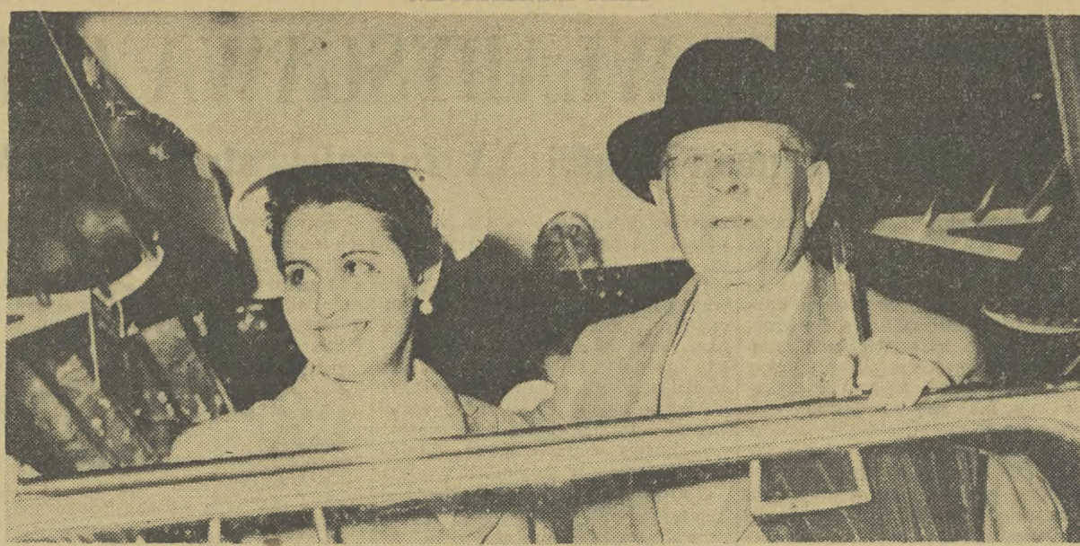
Do Paryża przybył słynny wiolonczelista 80-letni Pablo Casals ze swą młodą żoną. Ślub mistrza z jego 21-letnią uczennicą Marią Montanes odbył się niedawno w Porto Rico.