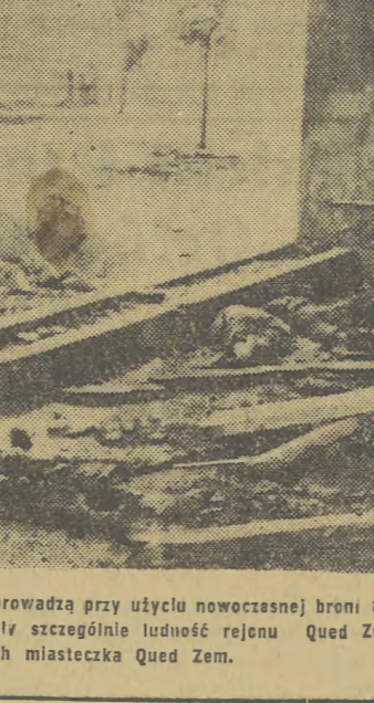
Oddziały francuskich kolonizatorów prowadzą przy użyciu nowoczesnej broni ciężkiej ofensywną przeciwko plemionom Berberów. Brutalne represje dotknęły szczególnie ludność rejonu Qued Zem. Na zdjęciu: ofiary walk na ulicach miasteczka Qued Zem.