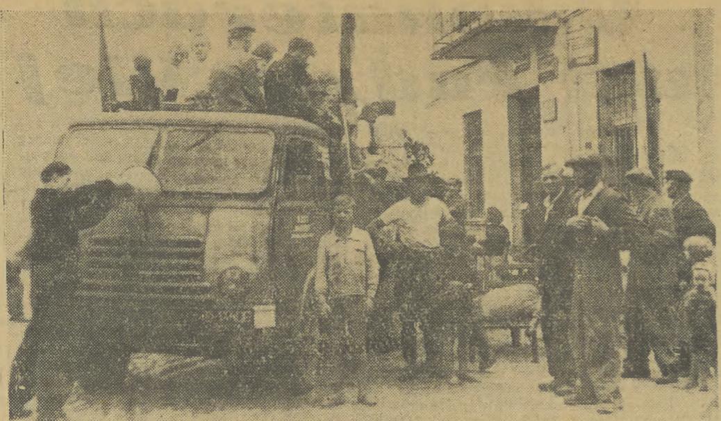
Chłopem w Zabierzowie Bocheńskim pomaga w odstawie zboża do punktu skupu w Niemcewicach ekipa łączności „MOTOZBYTU” z Krakowa, pożyczając samochód z obsługą (patrz wiadomość na str. 1). Na zdjęciu: transport ziarna w chwili odjazdu z Zabierzowa.