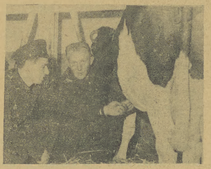
Kolejarze znają się na zwierzętach domowych — przekonaliśmy się o tym podczas spotkania w Libertowie. (Patrz artykuł obok).

W niedzielę, 28 sierpnia br., kolejarze ze stacji Kraków zorganizowali spotkanie w spółdzielni produkcyjnej w Libertowie. W spotkaniu tym wzięli również udział przewodniczący pracy z Zakładów Budowy Maszyn i Aparatury w Krakowie oraz delegacja indywidualnych gospodarzy z gromady Poporzysko.