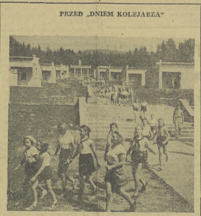
Polska Ludowa otacza dużą troską kolejarzy i ich rodziny. Jednym z przejawów tej troski jest to, że w b. roku wyjechało na kolonie letnie blisko 27 tys. dzieci kolejarzy, a ponad 2 tys. przebywało na półkoloniach. Na zdjęciu: dzieci kolejarzy krakowskich na kolonii w Zembrzycach nad Skawą.

Dzisiaj zespół zwiędzi Mu- zeum Oświęcimskie i da wy- stęp dla załogi Pabłoku w Chranowie. Z Krakowa ze- spół udaje się do Kielc i War- szawy, skąd powróci do oj- czyzny.