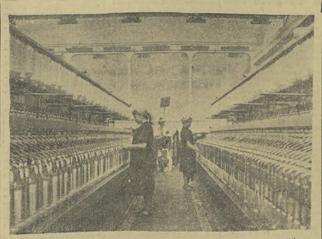
Zakłady Andrychowski w stacji rozbudowie. Dwa lata temu powstała no- woczesna hala ciekopłynna a obecnie na ukończeniu są prace przy budowie nowej hali średniopiętnej. Andrychowski Zakłady Przemysłu Bawełnianego produkcją m. in. popieliny, inlet (na wyspy), balyst oraz materiały na płaszcze prochowe. Część produkcji kierowana jest na eksport. — Na zdjęciu: fra- gment hali oddziału ciekopłynnego.

Jak donosi z Kairu agencja AFP, premier Chińskiej Re- publiki Ludowej Czou En-lai przybędzie w końcu bieżącego roku do Egiptu.