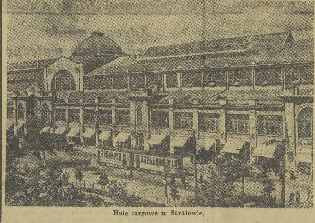
Hale targowe w Saratowie.