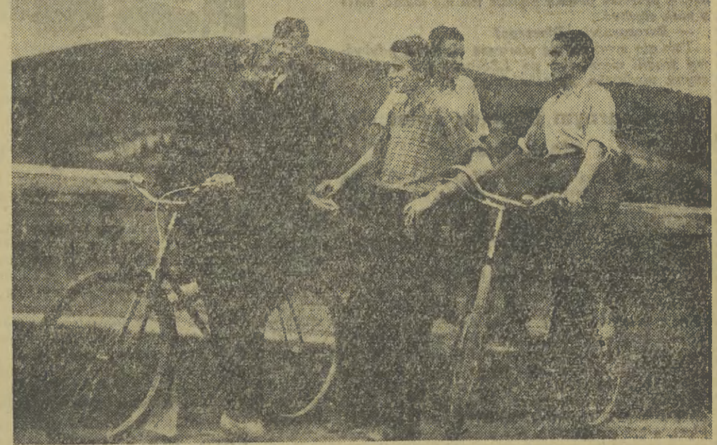
Wielką przyjemnością jechać na rowerze piękna, równa jak stół szosa. Wybrali się tak właśnie w dwóch, gdy spotkali na drodze trzech kolegów „nierowerzystów”. Krótki postój, przyjacielska pogawędka i dalej w drogę piki sprzyja piękna pogoda.