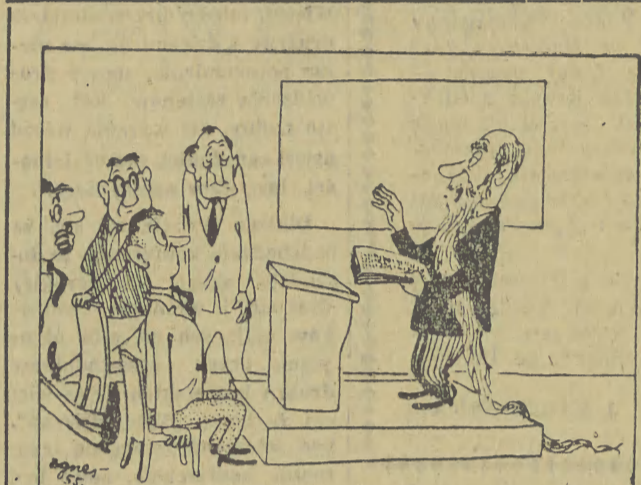
— Ja tu, towarzysze, z ramienia kola ZMP....