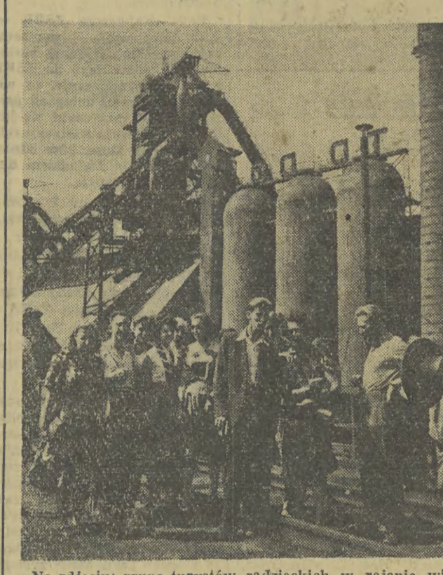
Na zdjęciu: grupa turystów radzieckich w rejonie wielkich pieców Huty im. Lenina.