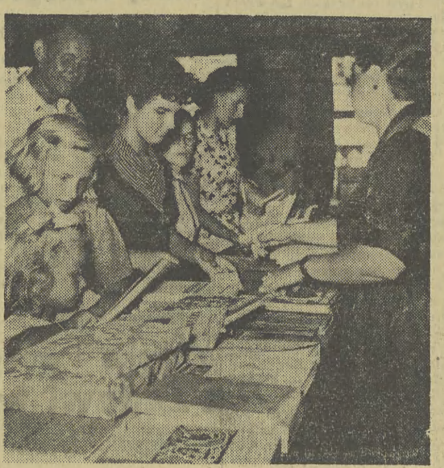
1 września rozpoczyna się w szkołach ogólnokształcących rok szkolny. W krakowskich księgarniach i sklepach z materiałami piśmiennymi panuje ożywiony ruch. Na zdjęciu: młodzież szkolna kupuje podręczniki.