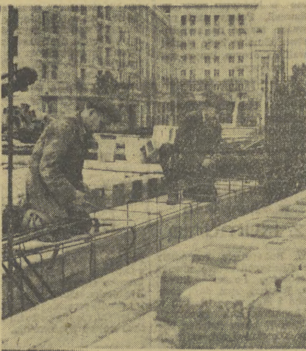
Tak wygląda zbrojenie słupów betonowych (ukrytych jeszcze w razie w widocznych na ilustracji wąskich i długich „pokrowcach” z tarcicy) na wielkich budowach. W ten sposób powstają elementy żelazo-betonowe.