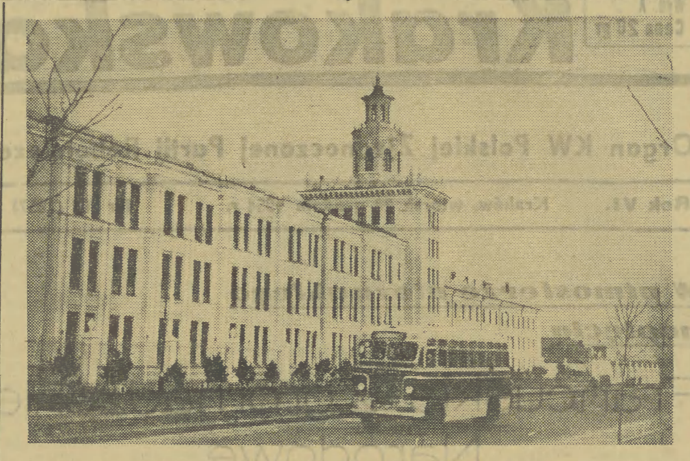
Bydowa pierwszej nowoczesnej fabryki narzędzi precyzyjnych w Charbinie ukończona została w sierpniu 1954 r. Fabryka jest jednym z głównych obiektów pierwszego planu pięcioletniego Chińskiej Republiki Ludowej.