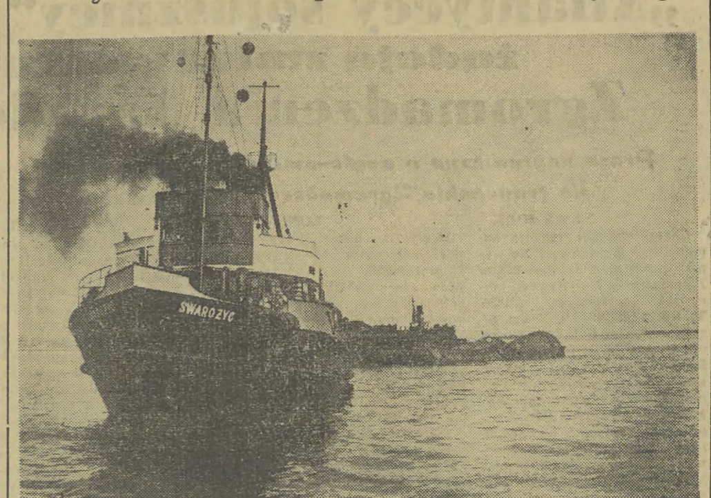
Nowym sukcesem Polskiego Ratownictwa Okręgowego jest wydobycie z dna Zatoki Gdynskiej pogiębiarki morskiej, jednej z największych w Europie, która zatopiona została w 1945 r. na trasie toru wodnego z portu gdynskiego w morze. Ze względu na wielkość pogiębiarki wrak wydobycie w dwu częściach, przy pomocy uprzednio zatopionych a później napelniczonych powietrzem wielkich stalowych pontonów.

Drugą część pogiębiarki po wydobyciu przyholowano do portu gdynskiego, gdzie zostanie uszczelniona i osadzona na mielinie w celu wykonania dalszych prac zabezpieczających. Pogiębiarka zostanie wyremontowana.