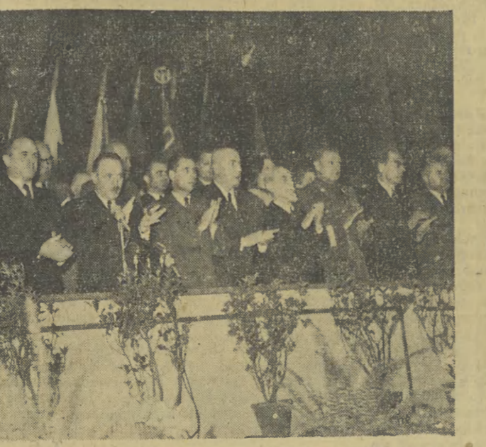
W dniu 22 stycznia 1955 r. w Hali Sportowej ZS „Gwardia” w Warszawie odbyła się uroczysta akademii w pięćdziesiątą rocznicę rewolucji 1905 roku. Na zdjęciu: prezydium akademii.