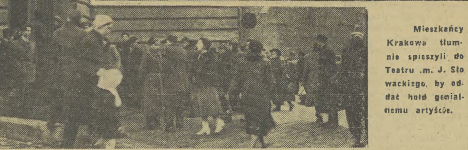
Mieszkańcy Krakowa tłumnie speszzyli do Teatru im. J. Słowackiego, by oddać hołd genialnemu artyście.

Nad gmachem Teatru im. Słowackiego żałobna flaga. Przed wejściem tłumy ludzi. Po raz ostatni społeczeństwo Krakowa składa w milczeniu hołd największemu aktorowi naszej epoki.