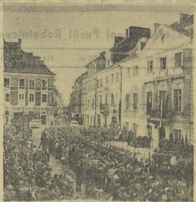
W 10 rocznicę śmierci członków warszawskiego sztabu AL na Starym Mieście w Warszawie społeczeństwo stolicy uczciło pamięć poległych wojowników. Na murze odbudowanego domu nr 16 przy ul. Freta, pod gzymsami którego ponieśli śmierć dowódcy warszawskich oddziałów AL, odsłonięto tablicę pamiątkową. Na zdjęciu: fragment uroczystości.