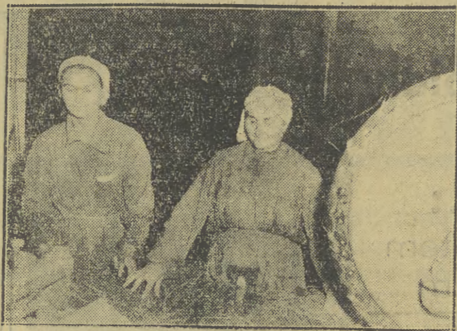
Nowo warunki kontraktacji roślin włóknistych przyczyniają się do dalszego rozszerzenia ich uprawy, a z kolei przetwórstwa. Na zdjęciu: maszynowe łamanie surowca w jednej z roszarni lnu.