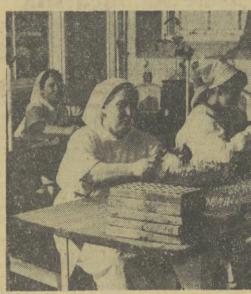
Poza produkcją penicyliny, zakłady produkują m. in. zastrzyki „Hepofort” (preparat witaminowy), witaminę DZ (przeciw krzywicy), preparaty barbiturkowe (środki znieczulające), adalinę (środek silnie znieczulający) i wysokiej jakości polokainę.