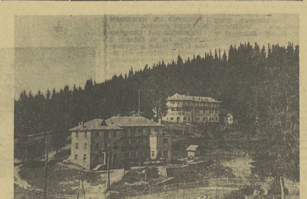
Na zdjęciu: Dom wypoczynkowy Centralnej Rady Związków Zawodowych „Wasyl Kolarow” w Pamorowo w Bulgarii.

Płyty spilnione produkowane w Fabryce w Czarnej Wodzie znajdują coraz szersze zastosowanie m. in. w budownictwie i przy produkcji mebli, zastępując w podłożeniu drewno. Wytrzymałość i trwałość płyt w porównaniu z drewnem urosła ponad dwukrotnie. Płyty obecnie wyrabiane w fabryce nie kruszą się, mają gładką powierzchnię i znaczenie lepszy połysk. W tym roku rozpoczęto także produkcję płyt twardej wysokiej jakości. Obecnie są w toku przygotowania do produkcji płyt spilnionych dźwiękochłonnych. Maszyny do produkcji tych płyt miały być sprowadzone z zagranicy. Odbiory wykazują coraz większe zainteresowanie płytami spilnionymi ze względu na coraz szersze możliwości ich stosowania. M. in. w Szwajcarii Fabryka Mebli stosuje się płyty spilnione przy produkcji szaf. Kierownictwo budowy Teatru Wielkiego w Warszawie zamówiło duże ilości płyt spilnionych. Czynione są próby zastosowania tego rodzaju płyt przy budowie statków, wagonów i samochodów.