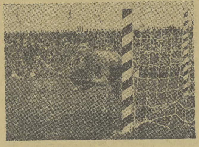
Krakowska Gwardia i tym razem miała pecha do Unii. przegrana ostatnio w Krakowie 0:2. Na zdjęciu: Unia Człozów wyprzedziła na boisku.

Kraków. - W Zabierzowie k. Krakowa odbyła się Spartaakiada z udziałem reprezentacji LZS-ów z województw krakowskiego, poznańskiego, rzęsowskiego i stalagrodzkiego - o prawo uczestniczenia w Centralnej Spartakiadzie LZS w Szczecinie. Na program spartakiady dołożyły się rozgrywki w piłce ręcznej mężczyzn i kobiet, siatkówkę i koszykówkę mężczyzn i kobiet oraz zawody piłkarskie. Niespodzianką była porażka reprezentacji piłkarskiej woj. stalagrodzkiego z reprezentacją w. rzęsowskiego 1:3. W piłce ręcznej mężczyźni pierwsze miejsce zajął Poznań, który pokonał Kraków 14:9, a w konkurencji kobiet zwycięstwo odniosła drużyna rzęsowska, wygrywając z Poznaniem 2:1.