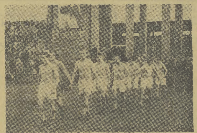
Na zdjęciu: (poniżej) przysięgli mistrzowie pierwszej ligi Unia Człozów wyprzedziła na boisku.