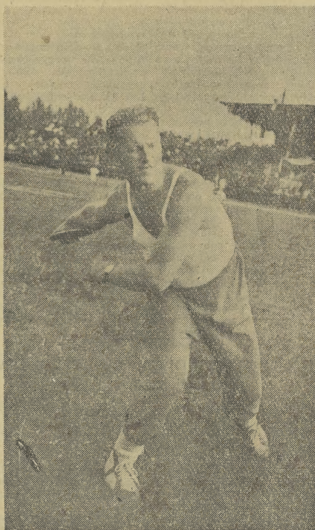
W ub. czwartek zakończył się w Krakowie II Centralna Spartakiada ZS Gwardia. Na boiskach, bieżniach, pływalni i kortach trwały ambitne walki „gwardzistów” o tytuł najlepszego zawodnika czy zespołu.