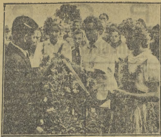
Chłopi polscy uroczysto i radośnie obchodzą swoje doroczne święto plonów — dożynki.

W Dolinie Chochołowskiej oddano do użytku nowe, największe w Tatrach schronisko górskie. Piękny, malowniczo położony budynek schroniska o kubaturze ok. 10 tys. m sześć., pomieścić może ponad 200 turystów. Uruchomienie tego obiektu umożliwi dalszy rozwój masowego ruchu turystycznego w tej mało dotychczas uczęszczanej części Tatr. W zimie schronisko to, położone przy wspaniałych terenach narciarskich, stanowić będzie doskonałą bazę dla turystyki zimowej i szkolenia narciarskiego.