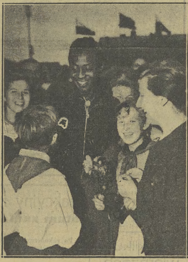
Do Warszawy przybyli zagraniczni studenci — delegacja na III Światowy Kongres Studentów, który rozpocznie się dziś, w dniu 27 bm. Na zdjęciu: fragment powitania na Dworcu Głównym.

Radosny, niecodzienny nastrój panuje w stołcu. Warszawa wita studentów całego świata.