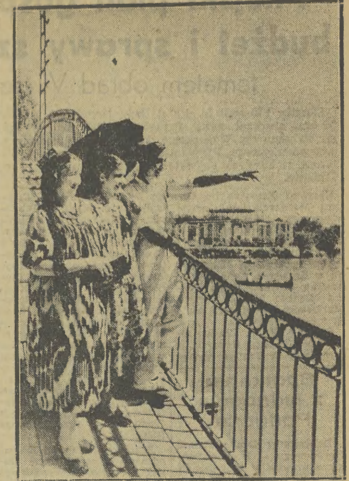
Jednym z przejawów troski o zdrowie i wypoczynek ludzi pracy w Związku Radzieckim jest stale wzrastająca liczba sanatoriów, parków, domów kultury i innych obiektów o charakterze społecznym, rozrywkowym na terenie całego kraju. Na zdjęciu: Park Kultury i Wypoczynku w Taszkencie.

Trzeba — mówił tow. Titkow — rozpocząć intensywną walkę o polepszenie kierownictwa partyjnego poprzez — przede wszystkim