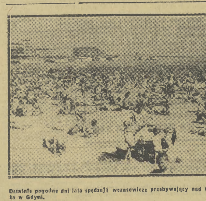
Ostatnie pogodnie dni lata spędzają wczasowicze przebywający nad morzem na plażach. Na zdjęciu: plaża w Gdyni.

Po zatwierdzeniu scenopisu, został skierowany do produkcji nowy polski film fabularny pt. „Żelazna kurtyna”. Autorami scenariusza są Tadeusz Konwicki i Kazimierz Sumerski. Film reżyseruje K. Sumerski, operatorem jest S. Karecki.