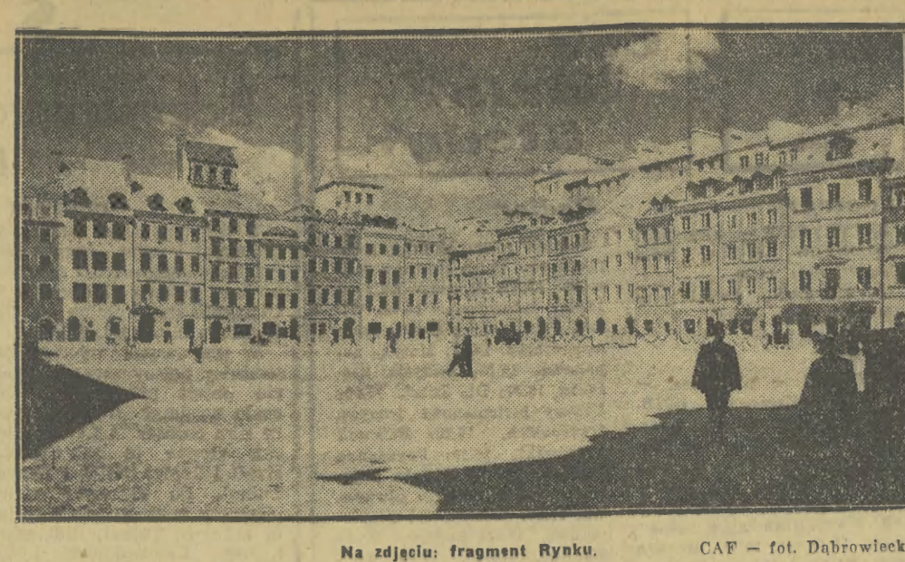
Na zdjęciu: fragment Rynku.