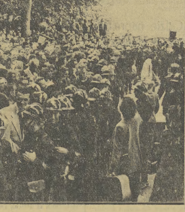
Odpowiedział mas pracujących na nadzwyczajną dekretu rządowe gotujące w prawa ludzi pracy i pogarszające ich warunki bytu jest we Francji coraz potężniejsza fala strajków, która objęła już ponad 4 miliony pracowników. Na zdjęciu: podwórni darenie oczekują otwarcia wejścia na dworzec Austerlitz w Paryżu. Ruch kolejowy został wstrzymany z powodu strajku kolejarzy.

MOSKWA Agencja TASS podaje: Jak wiadomo, greckie wyspy Kefalonia, Itaka i Zakynthos nawiedziło ostatnio trzęsienie ziemi. Szereg miast i osiedli zostało zburzonych, wiele ludzi zginęło, tysiące osób zostało bez dachu nad głową i bez środków do życia. Radziecki Czerwony Krzyż postanowił okazać pomoc ludności greckiej, która ucierpiała wskutek trzęsienia ziemi i przekazał komitetowi wykonawczemu Greckiego Czerwonego Krzyża następującą depeszę: „Prezydium komitetu wykonawczego Związku Towarzystw Czerwonego Krzyża i Czerwonego Polskiego Związku wyraża w imieniu społeczeństwa radzieckiego głębokie współczucie narodowe greckiemu w związku z klęską żywiołową, która dotknęła ludność wysp: Kefalonia, Itaka i Zakynthos. Pragnąc przyjąć z pomocą ludności, która ucierpiała wskutek trzęsienia ziemi, Związek Towarzystw Czerwonego Krzyża i Czerwonego Polskiego Związku przekazuje do dyspozycji Komitetu Wykonawczego Greckiego Czerwonego Krzyża 250 tysięcy rubli”.