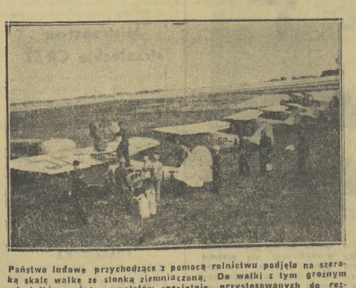
Państwo ludowe przychodzące z pomocą rolnictwu podjęło na szeroką skalę walkę ze słanką ziemniaczaną. Do walki z tym groźnym szkodnikiem użyto samolotów specjalnie przystosowanych do rozpylania środków owadobójczych. Na zdjęciu: zlatkowanie na samoloty środków owadobójczych.