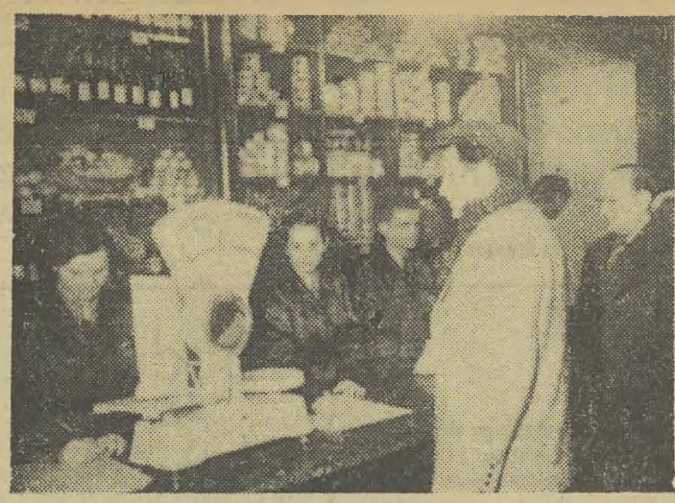
Placówki uspołecznionego handlu detalicznego przeżywiają gorące dni. Przed załadowanymi najpróżniejszymi towarami ludami przesuwają się dziesiątki i setki kupujących. Ciężko i nie łatwo jest obsłużyć na raz tylu klientów, z których każdy kupuje coś innego, wybiera... Niemniej jednak zadolane mamy odchodzących od stoisk świadczą, że zostali obsłużeni szybko i sprawnie.