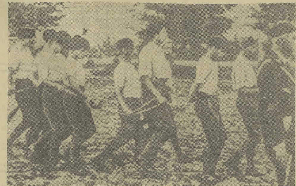
W Hiszpanii faszystowskiej przeszło milion Hiszpanów zostało zamordowanych w obozach koncentracyjnych. Na zdjęciu: młodzi patrioci, bojownicy o pokój są prowadzeni pod eskortą żołnierzy i oficerów frankistowskich na miejsce egzekucji.