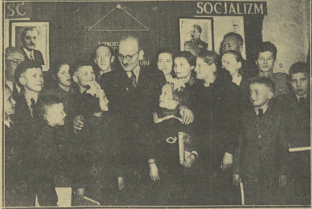
Dnia 21 grudnia 1952 r. prezes ZG Zbawid minister Franciszek Jóźwiak spotkał się z delegacją wychowanków Państwowego Domu Dziecka w Kruszynie — sierotami i półsierotami po bojownikach z faszystym o wolność i niepodległość Polski. Spotkanie upłynęło w bardzo serdecznej atmosferze.

Na dworcu obecni byli również szefowie szeregów przedstawicielstw dyplomatycznych akredytowanych w Warszawie.