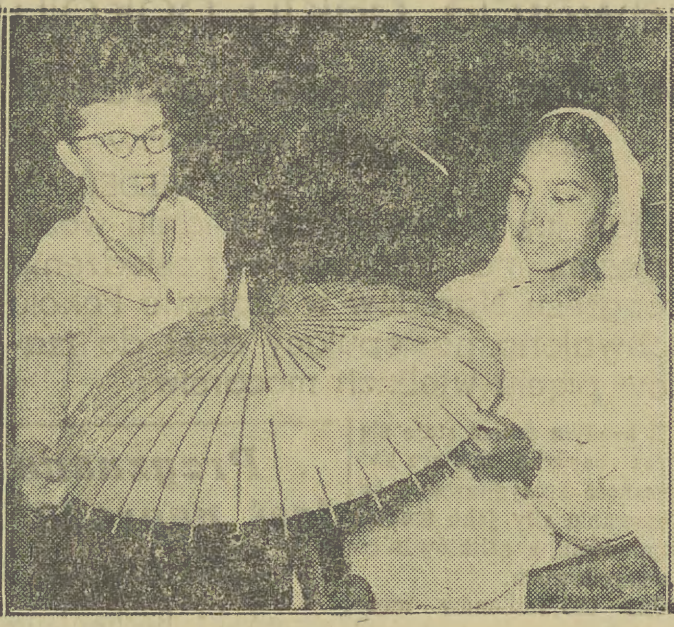
Na zdjęciu dolnym: przedstawicielka Stanów Zjednoczonych i przedstawicielka Indii oglądają pamiątkę z polskimi ofiarowanymi delegatom przez delegację Burmy. Na zdjęciu górnym: zebrani na sali delegaci entuzjastycznie manifestują swoje poparcie dla ordzdia i apelu Kongresu Narodów.

Przebieg głosowania nad rezolucjami w sprawie przyjęcia nowych członków do ONZ wykazał, że Stany Zjednoczone o-