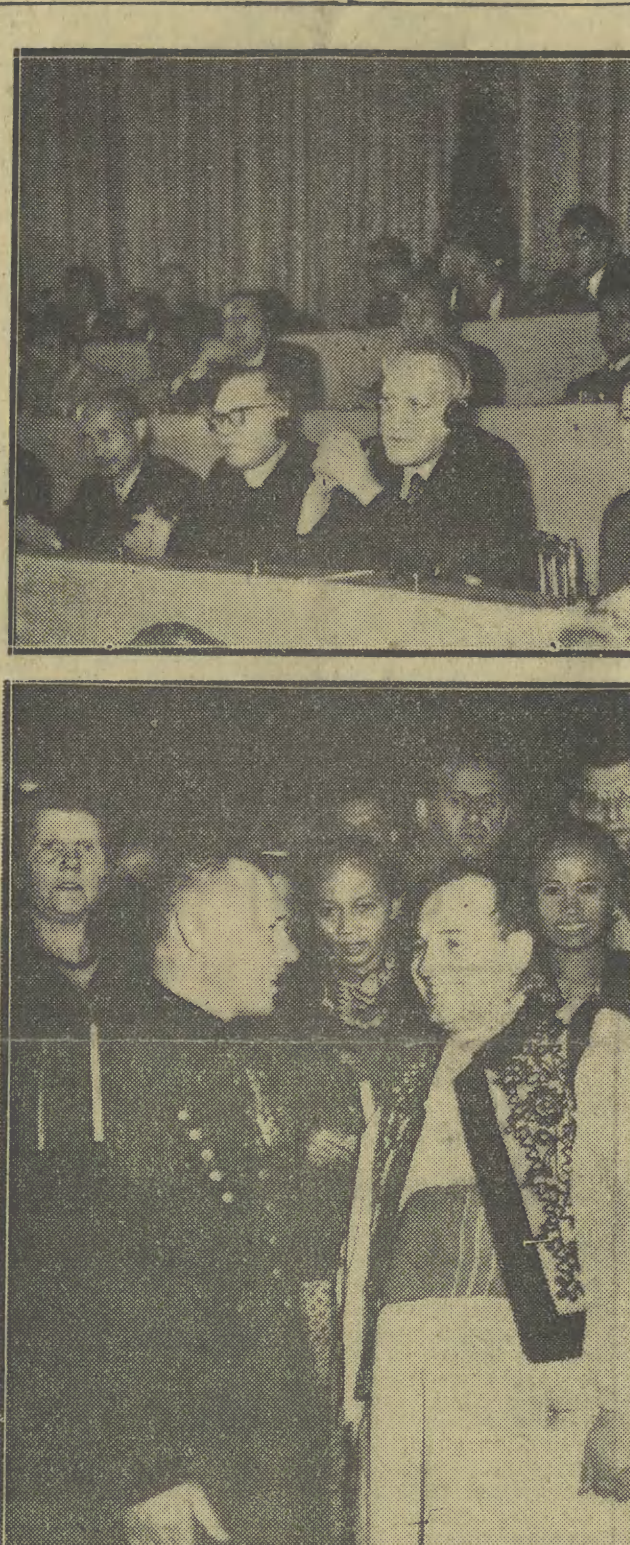
W dniu jutrzejszym w Krakowie I Zjazd Wojewódzki Związku Gminnych Spółdzielni „Samopomoc Chłopska”

Sprawozdanie z obrad Kongresu w dniu 17 bm. i przedstawienie korespondencyjnego planu rzu Hau Ser-jena oraz korespondencje z Wiednia podaje na str. 2.