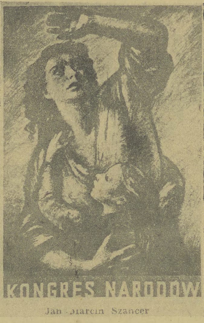
Jan Marcin Szancer

My, komunisty, kochamy wolność, lecz przeciwnie — tu niewola dla wszystkich. Czy wolno komunistom zgodzić się na taki stan, czy wolno mi zadowolić się jakakolwiek osobistą materią w ramach takiej „wolności”? — Nigdy! Dlatego też komunisty nie szczenią się sili ani ofiar w walce o wolność prawdziwą. Wolność coraz większą, wolność dla wszystkich.