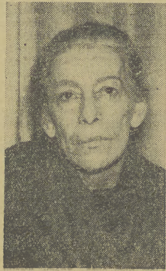
Helena Weigel w roli „Matki”

Przesyłam serdeczne pozdrowienia wszystkim polakom przyjacielom, z którymi wiążę nas wspólny cel, walka o pokój i budowa socjalizmu.