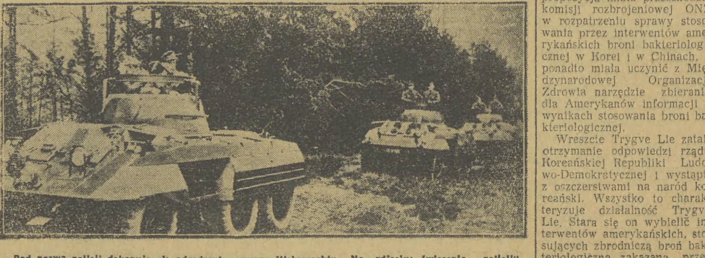
Pod nazwą polcji dokonuje się odrodzenie nowego Wehrmachtu. Na zdjęciu: ćwiczenia „polcji” zachodnio-niemieckiej.

Może się z niej wyłonić pożądany bodziec ekspansji handlu międzynarodowego, co może za sobą pociągnąć zmniejszenie napięcia międzynarodowego — w tych słowach tygodnik brytyjski „Spectator” określił znaczenie Konferencji Gospodarczej w Moskwie.