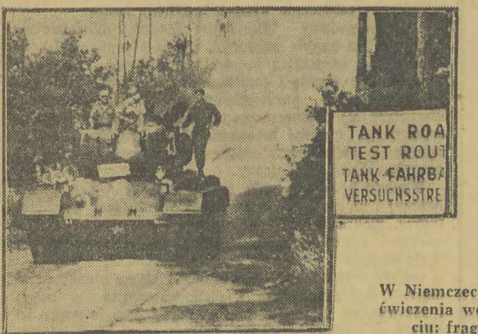
Po raz drugi w NRD

W więzieniach i obozach koncentracyjnych osadzono przeszło 25 tysięcy patriotów tuniskich — stwierdzają w swym liście Francuzi tuniscy. Jedyną ich winą było to, że walczyli o pokój i niezależność swej ojczyzny.