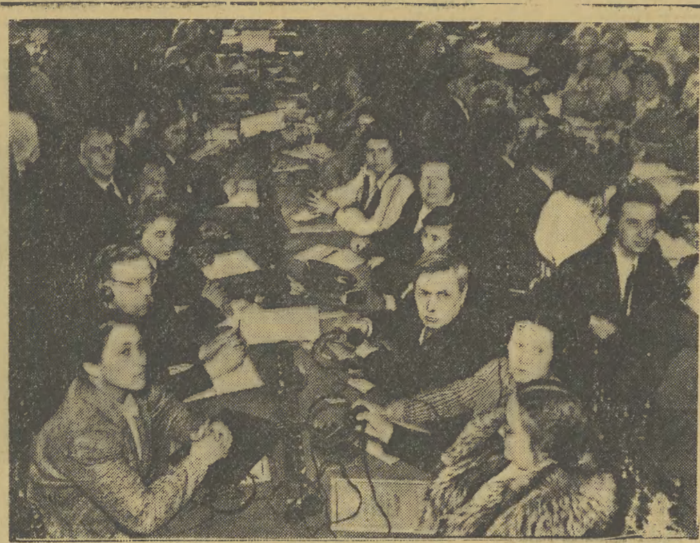
Z obrad międzynarodowej konferencji w obronie dziecka. Na zdjęciu: fragment sali obrad w Wiedniu. Na pierwszym planie delegacja radziecka.

Wszyscy Niemcy powinni przyłączyć się do potężnej kampanii protestacyjnej, która ogarnęła całą ludzkość.