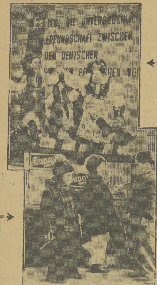
otoryfikacja gangsterzy - i mordu - oto amerykański styl wychowania. Styl ten rodzi morderców i ludobójców, tak potrzebnych amerykańskiemu faszyzmowi i jego krwiożerczej polityce wojny i agresji.

W NRD kwiecień jest miesiącem przyjaźni z narodem polskim. W miesiącu tym odbywają się akademie i imprezy poświęcone życiu Polski Ludowej.