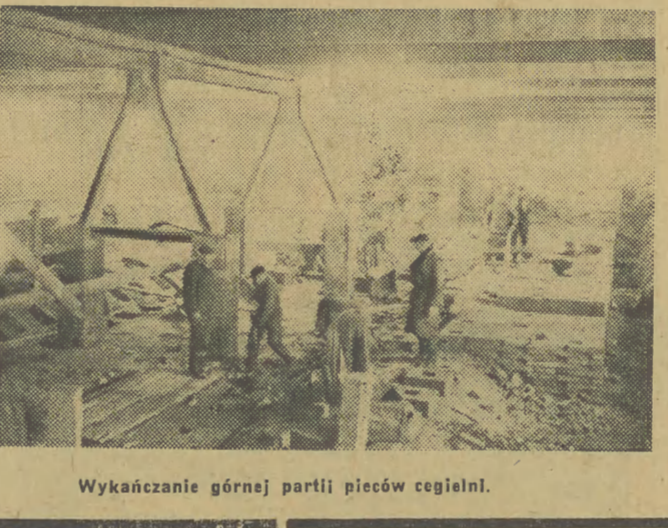
Wykańczanie górnej partii pieców cegielni.