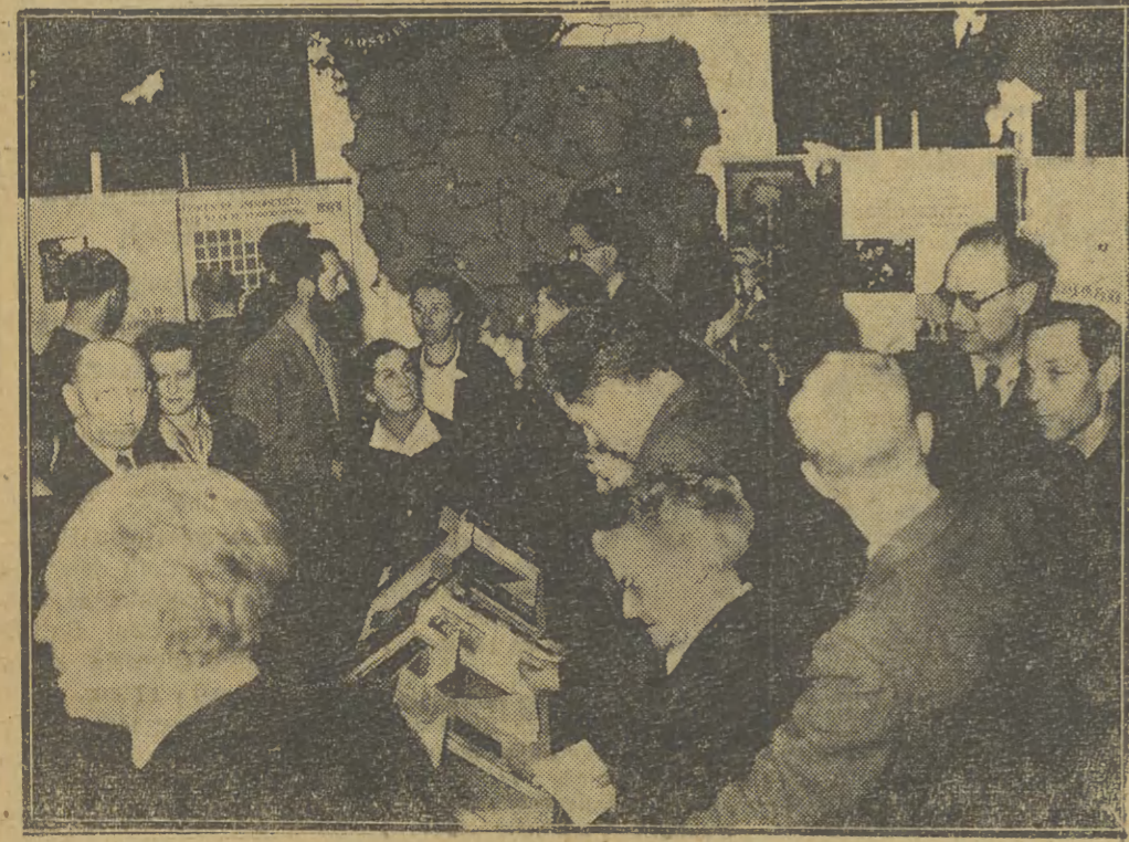
Wystawa „Nauka i szkolnictwo wyższe w Polsce Ludowej” została zorganizowana w Amsterdamie przez Towarzystwo Przyjaźni Holendersko-Polskiej. Fot. — CAF

W odpowiedzi wiceminister Golański wyraził podziękowanie rządowi radzieckiemu za przekazanie cennych dokumentów kultury polskiej, wskazując zarazem na postępowanie