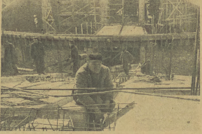
Zdjęcie powyższe przedstawia betonowanie magazynu na glinę w powojującej cegielni.