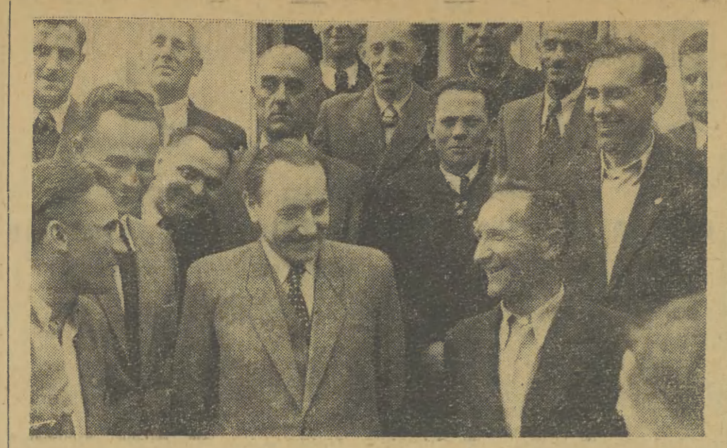
Na zdjęciu: Prezydent RP Bolesław Bierut w otoczeniu przedowników pracy. Krajowa narada przedowników, racjonalizatorów i nowatorów ludownictwa — 1949 rok.

Na ten rok przewidujemy uruchomienie wielu nowych zakładów produkcyjnych, osłabienie lat poprzednich pozwoli nam w tym roku przyspieszyć wykonanie Planu o trzy i pół miesiąca. W końcu roku nasza produkcja przemysłowa będzie przeszło 3 razy większa niż w 1938 r., a w przeliczeniu na głowę ludności przeszło 4 razy większa.