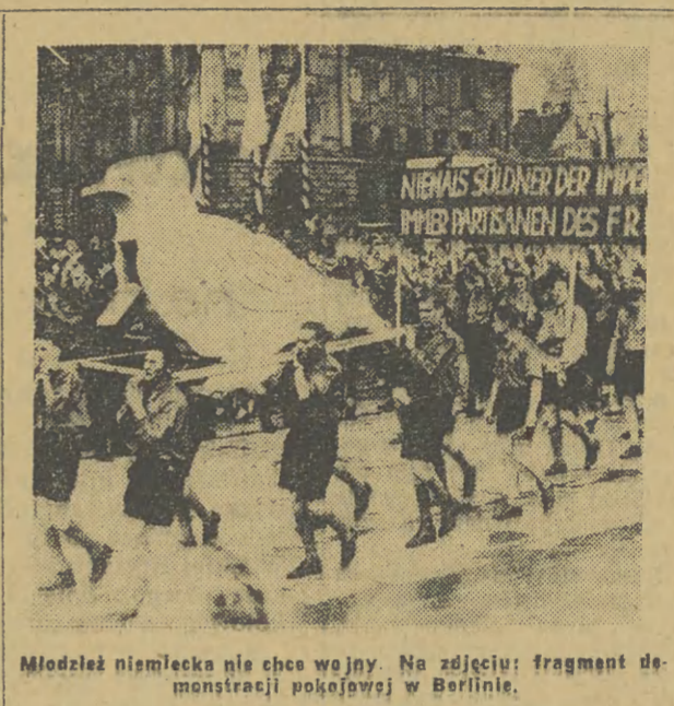
Młodzież niemiecka nie chce wojny. Na zdjęciu: fragment demonstracji pokojowej w Berlinie.

Wśród tych 40 i 70-letnich nieskończonych szeregów, które przez 8 godzin maszerowały 12 sierpnia 1951. przez Plac Marksa-Engelsa przed Prezydentem Pieckiem było 36 tysięcy młodzieży niemieckiej przybyłej z zachodu. Tyle ich przetrwać zdołało graniczne kordony — nieraz pod kulami, a za weze pod groźbą aresztowania, znaczenia się, bicia. Obecność tych rzesz młodzieży z Trizonią była żywym dowodem, że i tam hasła obrony pokoju i przyjaźni narodów parowały za sobą rzesze młodych Niemców. Na nie nie zdążyły się polityczne kordony, na nie faszystowski zakaz działalności FDJ w Trizoni. A zresztą te same hasła, które ożywiają młodzież zorganizowaną w FDJ, znajdują coraz szersze echo także i w innych środowiskach. Czyż nie jest wymowny fakt, że pierwszą ofiarą szpiegostwa politycznego terroru przeciw przedzierającej się na Złot do Berlina młodzieży z Trizonią był młody członek socjaldemokratycznej organizacji młodzieżowej „Fakke” („Sokol”). Był on jednym z licznych „Sokółów”, którzy wbrew zakazowi schumacherowskiego kierownictwa ruszyli do Berlina. Utonął, zaszczuty przez policję w granicznej Łabie.