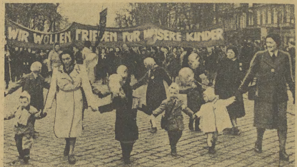
Demonstracja pokojowa w Wiedniu. Napis na transparentie głosi: „Chcemy pokoju dla naszych dzieci”.

Wiemy, że szlachetna młodość, która kształtuje swój charakter w tym porywającym okresie pięknej i trudnej walki, może dać naszej ojczyźnie produkcyjnych bojowników przyszłości, ludzi odczuwających patos naszych rewolucyjnych dni, umiających prze-