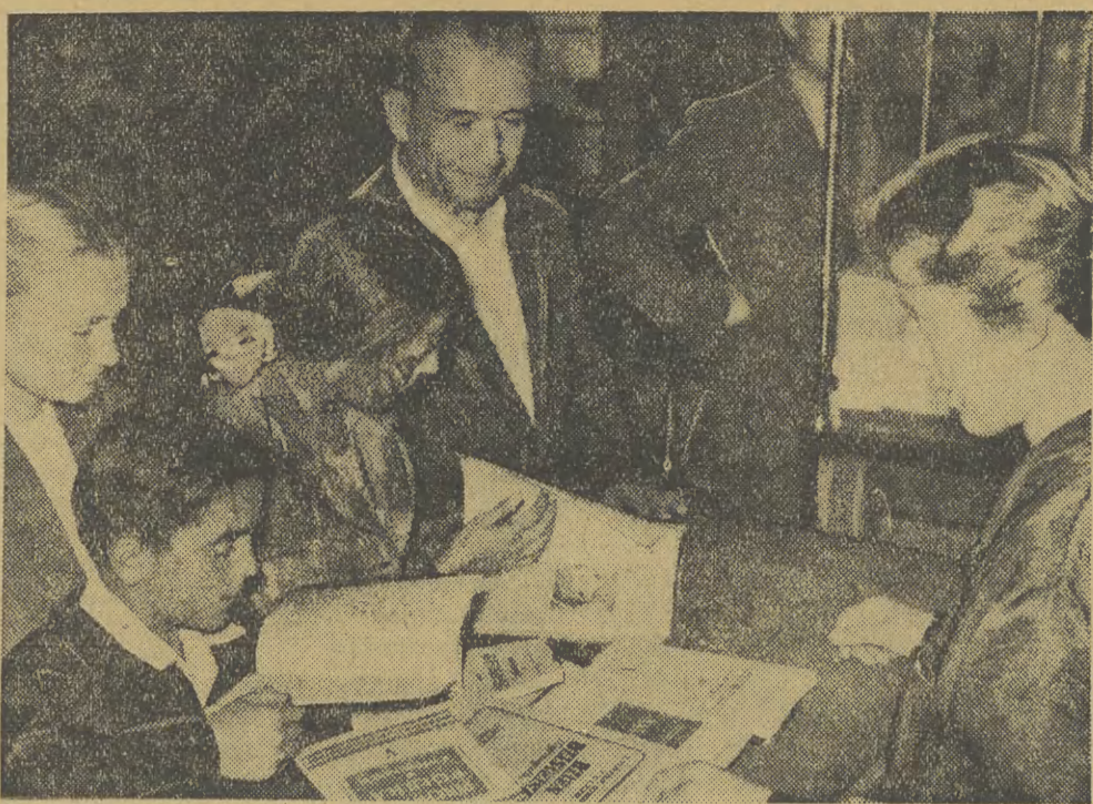
Młodzież szkolna zaopatruje się w podręczniki w doskonale zaopatrzonych księgarniach „Domu Książki”