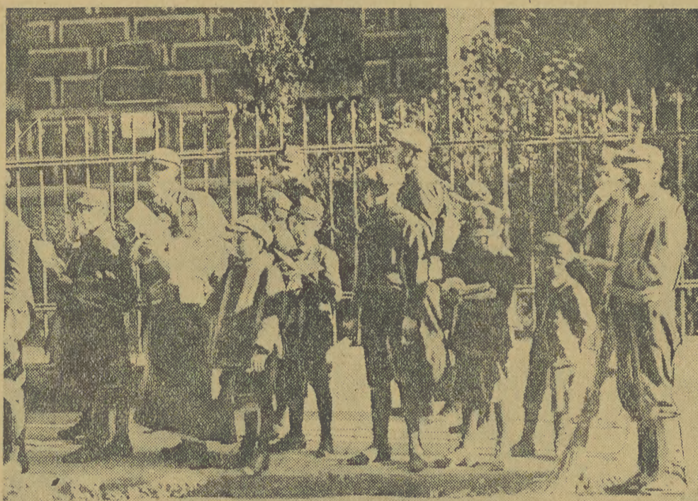
Wygórowane ceny i niskie nakłady podręczników szkolnych przed wojną zmuszały młodzież do handlu ulicznego książkami, Władze szkolne i pozostające w prywatnych rękach firmy wydawnicze nie interesowały się zgubieniem uprzywilejowania młodzieży szkolnej tanich pomocy naukowych