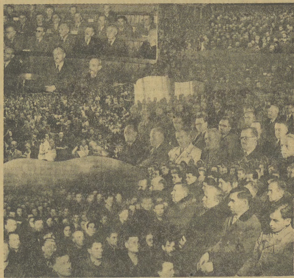
artykuły 33 i 36 naszej ordynacji wyborczej ustalają za prawo zgłaszania kandydatów na posłów przysługujące organizacjom politycznym, zawodowym i spółdzielczym, Związkowi Samopomocy Chłopskiej, Związkowi Młodzieży Polskiej oraz innym organizacjom społecznym ludu pracującego.

Organizacje te mogą zgłaszać kandydatów zarówno z własnej inicjatywy jak również spośród osób wysuniętych na zebraniach w zakładach pracy, na zebraniach gromadzkich, zebraniach członków spółdzielni produkcyjnych, pracowników PGR i żołnierzy w jednostkach wojskowych. Oznacza to sposób bezpośredniego zgłaszania kandydatów przy czynnym udziale wyborców. Oznacza to, że ludzie pracy bezpośrednio decydują o tym, kto ma zostać kandydatem.