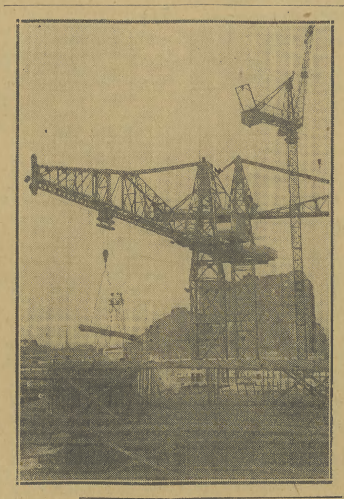
Prace przy budowie Pałacu Kultury i Nauki połączają w szczytnym tempie naprzód. Na zdjęciu: zbrojenie szkieletu ściany fundamentu

Zgon Schumachera BERLIN Agencja ADN donosi, że 20 sierpnia wieczorem zmarł w Bonn, w wieku 56 lat, przewodniczący Socjal-Demokratycznej Partii Niemiec (SPD) — Kurt Schumacher.