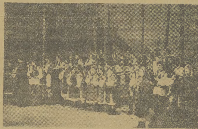
Scena zbiorowa z III aktu dramatu I. Franki „Skradzione szczęście“

peruaru z całym dłań pietyzmem i szacunkiem, które mogłyby być w pewnym sensie wzorem dla niektórych naszych teoretyków czy realizatorów usiłujących — nie zawsze po-