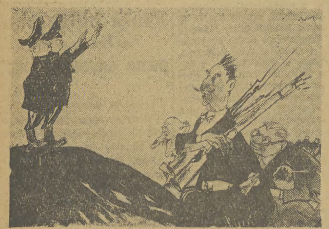
Acheson: Płon, niestety płon, „gospodarcom” w Bonn!