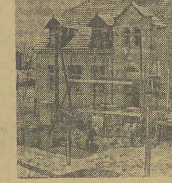
Mimo deszczowych dni jesiennych, prace przy budowie szkoły posuwają się szybko naprzód

W wyniku tej pracy szkoła rozrasta się o dwie nowe klasy,