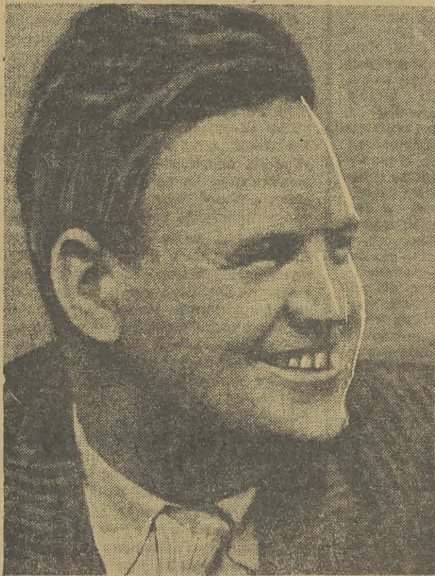
Maurice Thorez, sekretarz generalny FPK